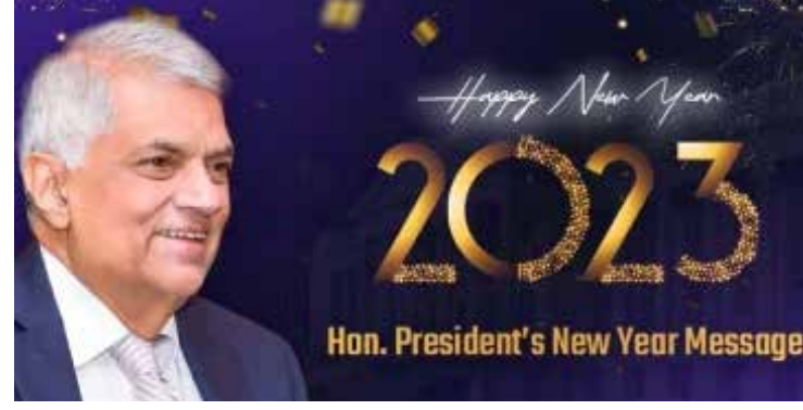
பிரித்தானிய காலனித்துவத்திலிருந்து இலங்கை சுதந்திரம் அடைந்து 75 ஆண்டுகள் நிறைவடைகின்றன.