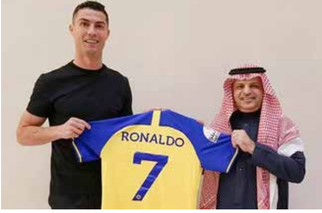
ரியாத், ஜன. 02

போர்த்துக்கல் உதைபந்தாட்ட அணியின் நட்சத்திர வீரரான கிறிஸ்டியானோ ரொனால்டோவை 20 கோடி டொலர்களுக்கு - நம் நாட்டு மதிப்பில் சுமார் 7 ஆயிரத்து 350 கோடி ரூபாய்க்கு ஒப்பந்தம் செய்துள்ளது சவுதி அரேபியாவின் அல் நசர் கழகம். 37 வயதான ரொனால்டோ இந்த கழகத்துக்காக 2025ஆம் ஆண்டு ஜூன் மாதம் வரை ஒப்பந்தம் செய்யப்பட்டுள்ளார்.