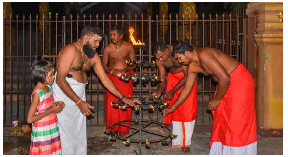
வரலாற்று பிரசித்தி பெற்ற நல்லூர் கந்தசுவாமி ஆலயத்தில் 2023 புதுவருடத்தை தீபமேற்றி வரவேற்ற சமயம்...!

விசாரணைகளின் அடிப்படையிலேயே இவ்விடயம் வெளிவந்துள்ளது. இதேவேளை குறித்த இரு பொலிஸ் உத்தியோகத்தர்களும், தம்மிடம் இருந்த காணொலியை பாடசாலை சிறுவர்கள் சிலருக்கு காண்பித்துள்ளனர் என்றும் பாதிக்கப்பட்ட சிறுமி வாக்குமூலம் அளித்துள்ளார். இச்சம்பவம் தொடர்பில் பருத்தித்துறை பொலிஸார் மேலதிக விசாரணைகளை முன்னெடுத்து வருகின்றனர். (ஐ)