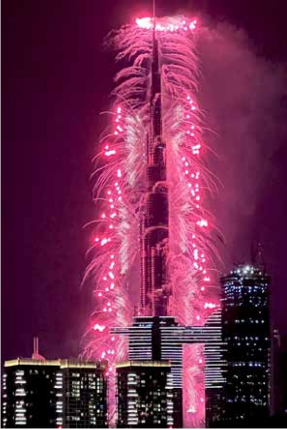
டூபாயின் பூர்கலிபா கட்டடத்தில்...!