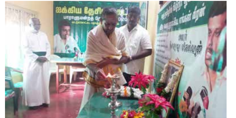
மாலை அணிவித்து மலர்தூவி அஞ்சலி செலுத்தப்பட்டது.

நிகழ்வானது பூஜை வழி பாட்டுடன் ஆரம்பமானது. திருவுருவ படத்துக்கு மலர்