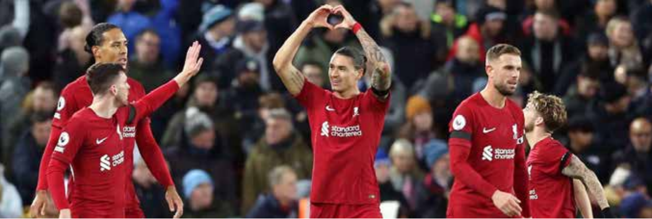
லண்டன், ஜன. 02

இங்கிலாந்தில் நடைபெறும் பிறீமியர் லீக் உதைபந்தாட்டப் போட்டியில் சனிக்கிழமை ஆட்டத்தில் லிவர்பூல் 2-1 என்ற கோல் கணக்கில் லெய்செஸ்டர் சிற்றியை வென்றது.