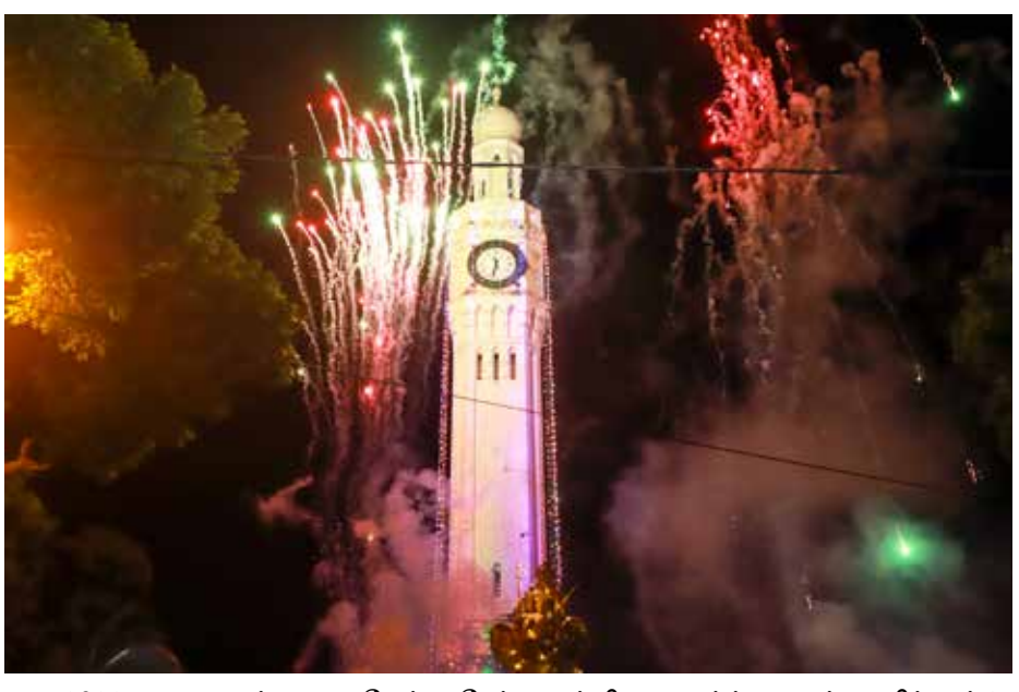
2023 புதுவருடத்தை வரவேற்று நேற்று நள்ளிரவு யாழ்ப்பாணம் மணிக்கூட்டு கோபுர பகுதியில் டான் தொலைக்காட்சி குழுமத்தின் ஏற்பாட்டில் வாணவேடிக்கை நடைபெற்றபோது...!

கொழும்பு, ஜன.02 மாத்தறை கடலில் நீராடச் சென்ற இரண்டு சிறுவர்கள் கடல் அலையில் சிக்கி உயிரிழந்துள்ளனர் என மாத்தறை பொலிஸார் தெரிவித்தனர். மாத்தறை அக்குரஸ்ஸ பிரதேசத்தை சேர்ந்த 17 வயதுடைய இரண்டு சிறுவர்களே இவ்வாறு உயிரிழந்துள்ளனர். நான்கு பேர் நீராடச் சென்றதாகவும் அதில் இருவரே உயிரிழந்துள்ளதாகவும் பொலிஸார் தெரிவித்தனர். இவர்கள் தங்கள் வீடுகளில் இருந்து மேலதிக வகுப்புகளில் கலந்து கொள்வதாக கூறி சென்றுள்ளதாக பொலிஸாரின் முத்தகட்ட விசாரணையில் தகவல் வெளியாகியுள்ளது. சம்பவம் தொடர்பான மேலதிக விசாரணைகளை மாத்தறை பொலிஸார் மேற்கொண்டுள்ளனர். (அ)