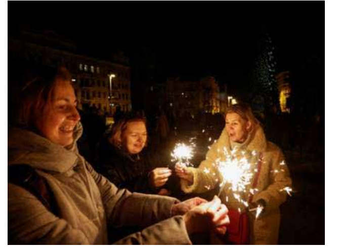
உக்ரைனின் கீவில் உரபங்குக்கு முன்பாக....