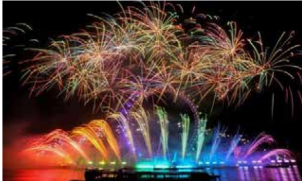
லண்டன் தேம்ஸ் நதியில்...

புதுவருடத்தை ஒட்டி உலக நாடுகளில் வான வேடிக்கையுடனான நிகழ்வுகளை முன்னெடுத்திருந்தனர். ஒவ்வொரு நகரங்களிலும் பல்லாயிரக் கணக்கான மக்கள் இந்த நிகழ்வுகளை கண்களித்தனர். (ஐ)