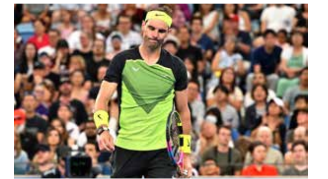
சிட்னி, ஜன. 02

அவுதிரேலியாவில் நடைபெறும் யுனைடெட் கிண்ணத்துக்கான கலப்பு ரென்னிஸ் போட்டியில் ஸ்பெயின் நட்சத்திரமான ரபேல் நடால் - இங்கிலாந்து இளம் வீரர் கமரூன் நோரியிடம் அதிர்ச்சித் தோல்வி கண்டார். நடாலை இத்துடன் 4ஆவது முறையாகச் சந்தித்த நோரி, அதில் முதல் வெற்றியைப் பதிவு செய்திருக்கிறார்.