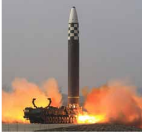
வடகொரியாவின் நலனை பாதுகாக்கும் நோக்கிலும் நாட்டின் இராணுவப் பலம் இரு மடங்காக்கப்படும்”, என்று அவர் கூறியுள்ளார். (ஐ)

“அணு ஆயுத உற்பத்தியை வேகமாக வடகொரியா அதிகரிக்கப்படவுள்ளது. அமெரிக்கா மற்றும் பிற பகைமை நாடுகளின் ஆபத்தான போக்குக்கு பதிலடி கொடுக்கும் வகையிலும்