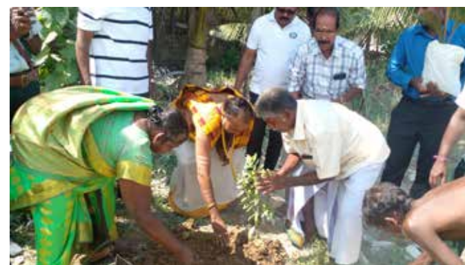
யாழ்ப்பாணம், ஜன. 02

இலங்கை முதல்தர விவசாய சங்கம் மற்றும் இந்து சமய தொண்டர் சபையினரால் ஒரு கோடி தாவரங்கள் நடுகை செய்யும் நிகழ்வு கைதடி கற்பக விநாயகர் ஆலய வளாகத்தில் நேற்று ஞாயிற்றுக்கிழமை காலை 11:30 மணியளவில் ஆரம்பித்து வைக்கப்பட்டுள்ளது.