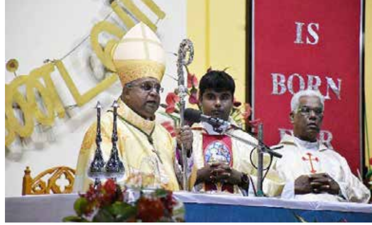
மன்னார், ஜன. 02