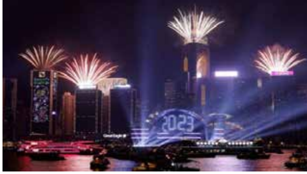
சீனாவின் - ஹொங்கொங்கில்....