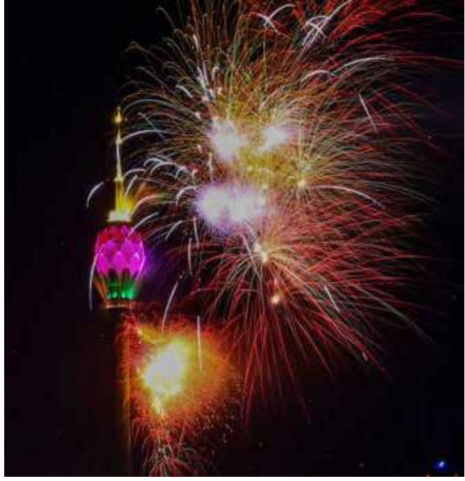
2023 புதுவருட தினமான நேற்று கொழும்பு தாமரை கோபுரத்தில் இடம்பெற்ற வானவேடிக்கை...!