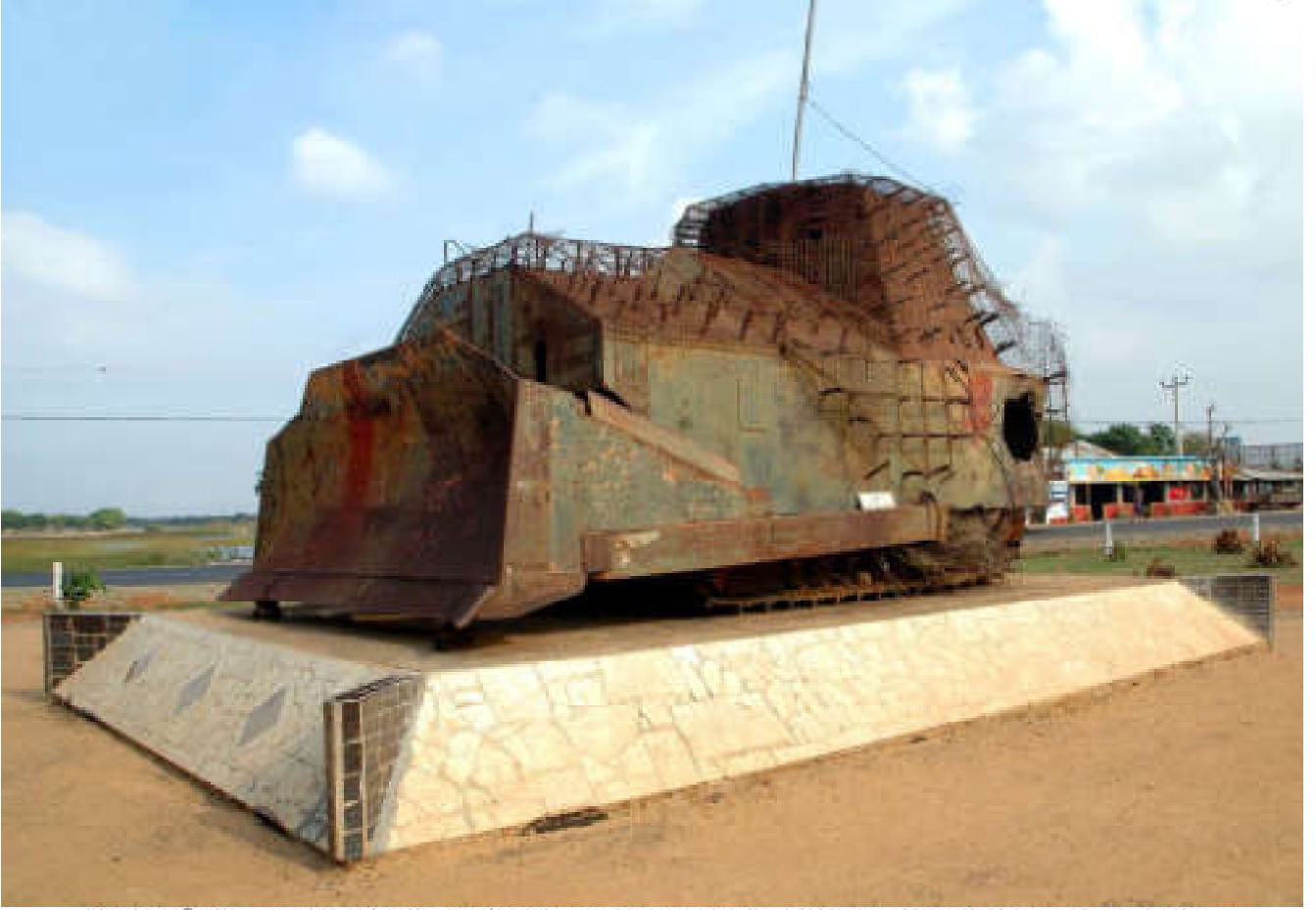
ஆணையிறவு முகாம் மீதான முதலாவது தாக்குதலுக்கும் புலிகள் பயன்படுத்திய கலாசனம்

முகாமுக்குத் தேவையான அரிசி, பருப்பு, தேங்காய், எண்ணெய் வகைகள், கருவாடு, ரின்மீன், சோயா, தேயிலை, சீனி ஆகிய அத்தியாவசியப் பொருள்களை உலங்கு வானூர்தி மூலம் இறக்கினோம். தொடர்ந்தும் உலங்கு வானூர்தியை ஆணையிறவு முகாமுக்குள் தரையிறக்கும் நிலை இருக்காது என்று கள நிலவரங்கள் காட்டின.