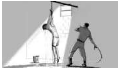
சித்திர்ப்பய்யுள் டங்களின் உரித்து பள்ளாட்டு மன்னியுச் சபைக்குரியது.

இலங்கையின் மலையகப் பகுதிகளில் கைதாகின்றவர்களுக்கு இயற்கையை வைத்தே தண்டனை வழங்குவதுண்டு. அந்தப் பிரதேசம் கடும் குளிருடையதாக இருப்பதால் மெத்தை, சாக்கு, கம்பளி, பெட்சீர் எதுவுமில்லாமல் இரவுப் பொழுதைக் கழிப்பது சிரமம். அவ்வாறான அறைகளில் விசாரிக்கப்படுபவர்கள் ஜட்டியுடன் அல்லது நிர்வாணமாக வெறும் சீமெந்து நிலத்தில் படுக்க விடுவார்கள். சிலவேளை நள்ளிரவில் குளிரான நீரைக் கொண்டுவந்து வெறும் தேகத்தில் ஊற்றிவிட்டுப் போவார்கள்.