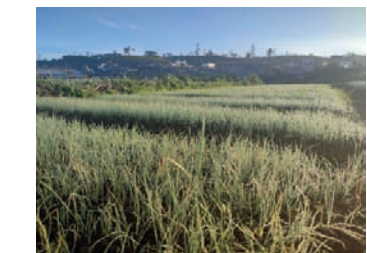
நுவரெலியாவின் வெப்ப நிலை 5 பாகை செல்சியஸாக காணப்பட்டதால் அதிகம் குளிரான நிலையை மக்கள் எதிர்கொண்டனர். இதேவேளை பூ பணிப் பொழிவால் தேயிலை, மரக்கறி மற்றும் மலர் உற்பத்திகள் பெரிதும் பாதிக்கப்பட்டுள்ளன.

நுவரெலியா நகரசபைக்கு உட்பட்ட பல இடங்கள் மற்றும் அம்பேவல, பட்டிபால ஆகிய பிரதேசங்களில் செவ்வாய்க்கிழமை (3) அதிகாலை பூ பணிப் பொழிந்துள்ளது. ஒவ்வொரு வருடமும் டிசெம்பர் மாதத்தில் நுவரெலியாவில் பூ பணிப் பொழியும். இந்த வருடத்தின் ஆரம்பத்தில் நுவரெலியா நகரிலுள்ள பூங்கா, தேயிலைத் தோட்டங்களில் பூ பணிப் பொழிவு காணப்பட்டது. செவ்வாய்க்கிழமை (3) அதிகாலை