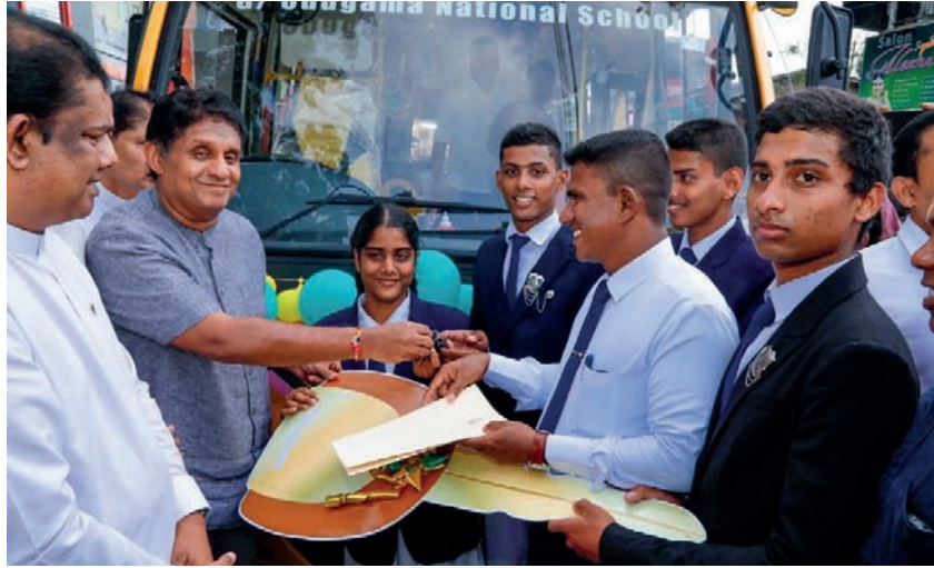
இலட்சம் (5,000,000) ரூபாய் பெறுமதியான பாடசாலை பேருந்து வண்டியொன்று காலி

வீம்பு பேச்சு பேசி நாட்டை கட்டியெழுப்ப முடியாது எனவும், சரியான குழுவடனும் சரியான தொலைநோக்குடன் நாட்டை கட்டியெழுப்புவதே மேற்கொள்ள வேண்டும் எனவும் எதிர்க்கட்சி தலைவர் சஜித் பிரேமதாஸ் தெரிவித்தார். பேருந்தை ஓட்டுகிறாரா, இல்லையா, என்பதை பார்த்து விமர்சிப்பதை விட, இந்த நடவடிக்கை பயனுள்ளதா? இல்லையா? என்பதை ஆராய்வது உசிர்ந்தது என தெரிவித்த எதிர்க்கட்சி தலைவர், நாட்டின் கல்விக்கட்டமைப்பை கட்டியெழுப்புவதற்கு என்ன விமர்சனம் வந்தாலும் முன்னெடுக்கும் பணிகள் நிறுத்தப்படாது என்றார். பிரபஞ்சம் வேலைத்திட்டத்தின் கீழ் 56 ஆவது கட்டமாக ஐம்பது