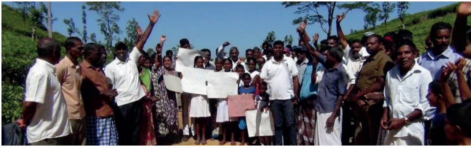
தோட்ட மக்கள் ஆர்ப்பாட்டத்தில் ஈடுபட்டனர்.

விரைவில் தேர்தல் நடைபெறவுள்ளது. எனவே, எமக்கான விதியை புனரமைத்து தராமல், அரசியல் வாதிகள் எவரும் உளர் பக்கம் வரக்கூடாது. அவ்வாறு வந்தால் அடித்து விரட்டுவோம் என ஹட்டன்- வெள்ளையா தோட்ட மக்கள் எச்சரித்துள்ளதன் செவ்வாய்க்கிழமை (3) ஆர்ப்பாட்டத்திலும் ஈடுபட்டனர். குறித்த தோட்டத்தைச் சேர்ந்த 4 வயது சிறுவன் ஒருவன் சுகவீனமுற்றிருந்த நிலையில், உரிய நேரத்தில் வைத்தியசாலைக்கு கொண்டு செல்வதற்கு வாகனம் கிடைக்காமல் காரணமாக திங்கட்கிழமை(2) உயிரிழந்துள்ளார். அத்துடன், வீதி குண்டும் குழியுமாக காணப்படுவதால் வெளியில் இருந்துகூட வாகனத்தை பெற முடியாத நிலையும் ஏற்பட்டுள்ளது. இந்நிலையில், இனிமேலும் உயிர்கள் காவு கொள்ளப்படுவதற்கு இடமளிக்க முடியாது எனவும், விதியை உடன் புனரமைத்து தருமாறு வலியுறுத்தியும்