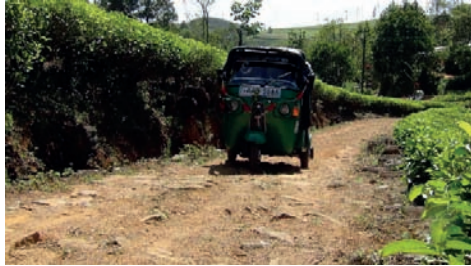
புனரமைக்கப்பட வேண்டும். அவ்வாறு இல்லாவிட்டால் அரசியல்வாதிகளை தோட்டத்துக்குள் விட மாட்டோம் எனவும் ஆர்ப்பாட்டத்தில் ஈடுபட்டிருந்தவர்கள் தெரிவித்தனர்.

சிறுவனின் மரணத்துக்கு இந்த வீதியும் ஒரு காரணம் என தெரிவித்த மக்கள், இனியும் மக்களை பலிகொடுக்க நாம் தயாரில்லை. எமக்கான வீதி