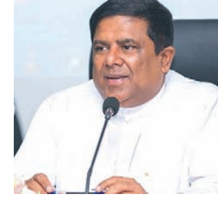
நேற்று (3) நடைபெற்ற ஊடகவியலாளர் சந்திப்பிலேயே அவர் இவ்வாறு தெரிவித்திருந்தார். எதிர்க்கட்சிகள் கூறுவது போல் பெரும் தொகையை

வீழ்ச்சி கண்ட நாட்டை ஜனாதிபதி மீட்டெடுக்க சகல நடவடிக்கைகளையும் முன்னெடுத்துவரும் அதே வேளையில், ஒருவரது குறுகிய அரசியல் நோக்கங்களுக்காக நாட்டை மீண்டும் அழிக்க இடமளிக்கப் போவதில்லை என ஐக்கிய தேசியக் கட்சியின் தலைவரும், பாராளுமன்ற உறுப்பினருமான வஜிர அபேவர்தன தெரிவித்திருந்தார். கட்சியின் தலைமையகத்தில் நேற்று (3) நடைபெற்ற ஊடகவியலாளர் சந்திப்பிலேயே அவர் இவ்வாறு தெரிவித்திருந்தார். எதிர்க்கட்சிகள் கூறுவது போல் பெரும் தொகையை வார்த்து இந்த தருணத்தில் வாக்கெடுப்பு நடத்தினால் மக்கள் வானவியில் விழுவார்கள் என்றும் வஜிர அபேவர்தன தெரிவித்திருந்தார். நாட்டின் இளைஞர்கள் கோரிய முறைமை மாற்றத்தை அமுல்படுத்துவதற்கு ஜனாதிபதி இணக்கம் தெரிவித்த போதிலும், எதிர்க்கட்சிகள் அதற்கு வெளியில் சென்று பழைய வேலைத்திட்டத்தில் செயற்படுவதாக வஜிர அபேவர்தன தெரிவித்தார்.