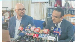
தேர்தல் செலவுகளை பணத்தை எங்கிருந்து பெற்றுக்கொள்வது என்று தீர்மானிப்பது போன்றவை தேர்தல் ஆணைக்குழுவினரின் கடமையாகும்.

யாழ்ப்பாணத்தில் நேற்று புதன்கிழமை ஊடக விவரலாசு தேர்வுக்கு கூடுதல் நெரிசெங்குப்பேத அவ்வாறு தெரிவித்தார். அவர் மேலும் தெரிவிக்கையில், தேர்தல் திணைக்களம் தீர்மானிப்பது, தேர்தலை நடத்துவது, இவ்வாறு என்ற தீர்மானிப்பது