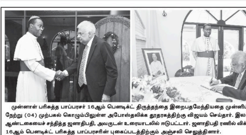
முன்னர் பரிசீலனை செய்யப்பட்டுள்ள சஜித் திட்டவாடமாகத் தெரிவித்தார்.

இவ்வாறு உத்தரவிடப்பட்டதில் சஜித் திட்டவாடமாகத் தெரிவித்தார். சஜித் திட்டவாடமாகத் தெரிவித்தார். சஜித் திட்டவாடமாகத் தெரிவித்தார்.