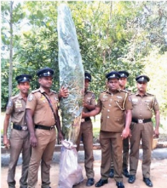
புத்தளம், நவகத்தேசம் பகுதியில் விவசாயத் தோட்டமொன்றில் எட்டிரோதமாக கஞ்சாச் செடிகள் வளர்த்தவரின் குற்றத்தின் சான்றுகள்.