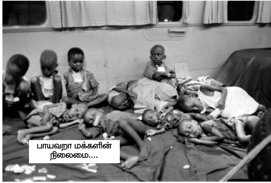
பாயவறா மக்களின் நிலைமை....

பிராந்திய ஒற்றுமை போன்ற பல அலங் கார கட்டுப்பாடுகளை கடந்து செல்ல வேண்டி உள்ளது. யுகோஸ்லாவியாவின் போர்கள் நடந்த பொழுது அதனது இறை மைமையில், உள்நாட்டுப் பிரச்சினைகளில் ஈடுபட ஐ.நா. தயக்கம் காட்டிய பொழுது ரஷ்யாவை பலவீனமாக்கும் முயற்சியில் அமெரிக்காவும் மேற்கு ஐரோப்பிய நாடு களின் ஒன்றியமும் நேட்டோ ஊடாக, அரசியலில் இணங்கியவர்களுக்கு ஆத ரவு அளித்துக் கொண்டிருந்தனர்.