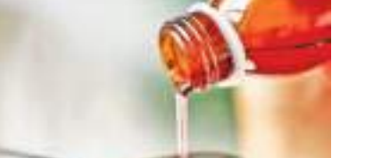
கைவிடும்படி உலக நாடுகளை கேட்டுக் கொண்டிருக்கிறது. எனினும் உஸ்பகிஸ்தானில் இடம்பெற்ற மரணங்களை அடுத்து உத்தர பிரதேச மாநிலம் நொய்ப்பாவில் செயல்படும் மரியான் பயோடெக் நிறுவனத்தின் உற்பத்தியை இந்திய சுகாதார அமைச்சு இடைநிறுத்தியமை குறிப்பிடத்தக்கது.

உஸ்பகிஸ்தானில் 19 உயிரிழப்புகளுடன் தொடர்புபட்ட இந்தியாவின் மரியான் பயோடெக் நிறுவனத்தால் தயாரிக்கப்படும் இரு இருமல் மருந்துகளை பயன்படுத்த வேண்டாம் என உலக சுகாதார அமைப்பு அறிவித்துள்ளது.