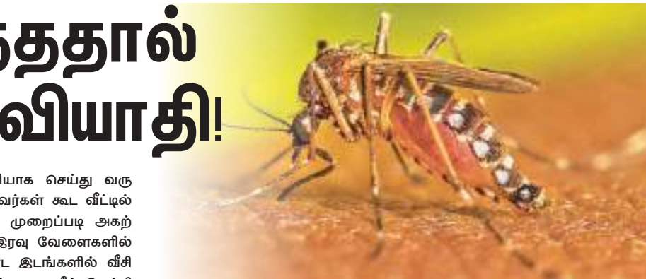
டெங்கு நுளம்புகள் மாரி காலத்தில் மனிதனின் அலட்சியப்போக்கினால் பெருகி மக்களை அச்சுறுத்தி அபாயத்தை யும் மரணத்தையும் ஏற்படுத்தி வருகின்றன. இந்த அபாயகரமான டெங்கு நுளம்பு பெருக்கத்திற்கு மனிதர்களே உதவியாக இருந்து வருகின்றனர் என்றே கூற வேண்டும்.

சுத்திகரிப்பு பணிகளை சரியாகச் செய்வது ஒரு சிறந்த போதிலும் சில படித்தவர்கள் கூட வீட்டில் சேரும் குப்பை கூழங்களை முறைப்படி அகற்றுவதில்லை. குப்பைகளை இரவு வேளைகளில் வீதி ஓரங்களில் கண்ட கண்ட இடங்களில் வீசி வருகின்றனர். இக்கழிவுகளின் மழைநீர் தேங்கி நின்று நுளம்பு பெருக்கம் அதிகரித்து வருவதை அவர்கள் கவனத்தில் கொள்வதில்லை.