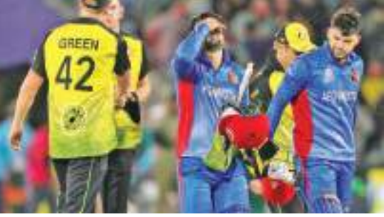
ஆப்கானுடனான ஒரே ஒரு டெஸ்ட் போட்டியையும் அவஸ்திரேலியா ரத்துச் செய்தது.

தலிபான் களின் பெண்கள் மீதான ஒருக்குமுறைக்கு எதிர்ப்புத் தெரிவித்து ஆப்கானிஸ்தானுக்கு எதிரான ஒருநாள் தொடரில் இருந்து அவஸ்திரேலிய அணி விலகியுள்ளது. ஐ.சி.சி சுப்பர் லீக்கின் அங்கமாக அவஸ்திரேலிய அணி வரும் மார்ச் மாதம் ஆப்கானிஸ்தானுக்கு எதிராக ஐக்கிய அரபு இராச்சியத்தில் மூன்று போட்டிகளை கொண்ட ஒருநாள் தொடரில் ஆடவிருந்தது.