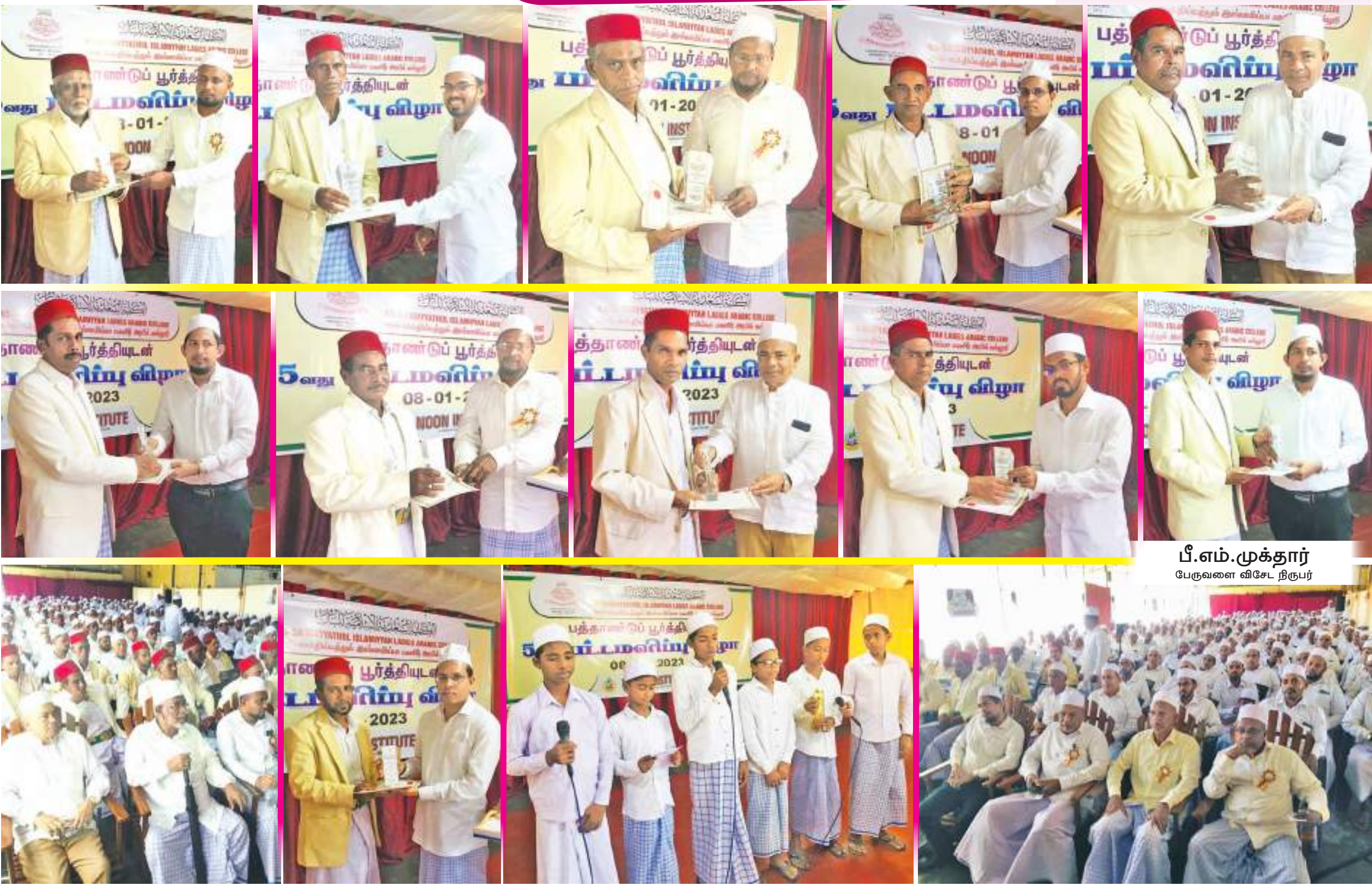
பீ.எம்.முக்தார் பேருவளை விசேட நிபுனர்