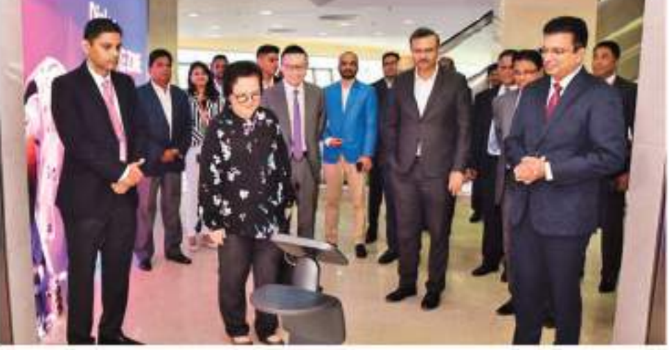
Humanoid Robot greeting visitors