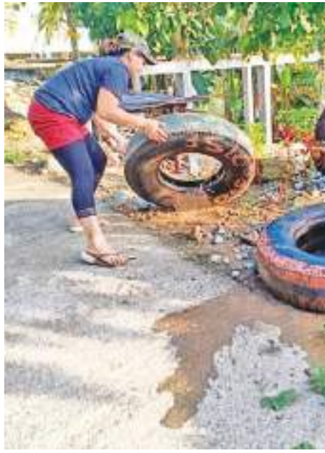
மக்கள் நுளம்புகளின் பெருக்கத்துக்கு உதவி வருகின்றனர் என்பதை ஏற்றுக் கொண்டு ஆக வேண்டும். ஆகவே நுளம்பு பெருக்கத்திற்கும் டெங்கு நோய் பரவலுக்கும் மக்களின் அறியாமையும் அசிரத்ததை போக்குமே காரணமாகும்.

நம்பிய பலர் சுற்றாடலை சுத்தமாக வைத்திருப்பதில் அதிக கவனம் செலுத்துவதில்லை. பிரதேச சபைகள், நகர சபைகள் மற்றும் மாநகர சபைகள் அன்றாடம்