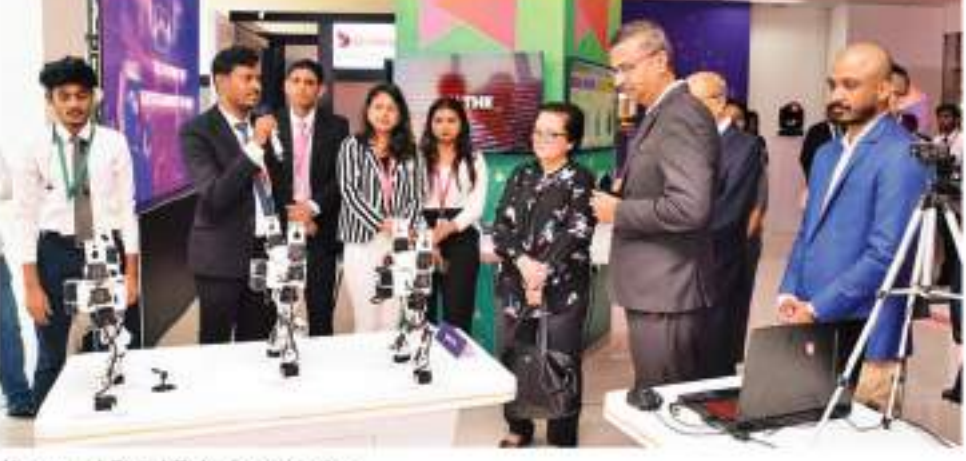
AI powered Digital Twin demonstration