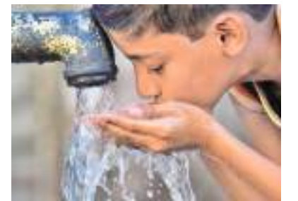
ரன் தலைமையில் நேற்று முன்தினம் (11) அப்பிரதேச செயலக கேட்போர் கூடத்தில் நடைபெற்றது. இதன்போது, மேற்படி குடும்பங்களுக்கு சுத்தமான குடிநீரைப் பெற்றுக்கொடுக்கும் வகையில் இக் குடிநீர் இணைப்பு வசதி வழங்கப்பட்டவுள்ளது.

அம்பாறை மாவட்டத்தின் திருக்கோவில் பிரதேசத்தின் 22 கிராம அலுவலர் பிரிவுகளில் கடந்த கால யுத்தத்தினால் பாதிக்கப்பட்ட, குறைந்த வருமானத்தைக் கொண்ட 56 குடும்பங்களுக்கு, திருக்கோவில் பிரதேச செயலகத்தின் ஊடாக இலவசமாக குடிநீர் இணைப்பு வசதி ஏற்படுத்திக் கொடுக்கப்பட்டவுள்ளது.