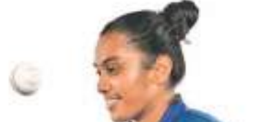
ஆட்டமிழக்காது 39 ஓட்டங்களை பெற்றார்.

19 வயதுக்கு உட்பட்ட மகளிர் டி.20 உலகக் கிண்ண போட்டியில் இலங்கை அணி தனது இரண்டாவது பயிற்சிப் போட்டியில் ஸ்கொட்லாந்து அணியை 7 விக்கெட்டுகளால் வீழ்த்தியது.