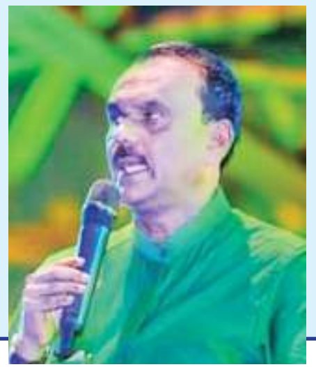
இலங்கை தேசியத்திற்காக ஒன்றிணைந்த பிரார்த்தனை

முகத்துவாரம் மிஷ்பா ஜெபமிஷனரி ஆலயத்தில் அருட்தந்தை எஸ்.ஜே.பெர்க்மான்ஸ்