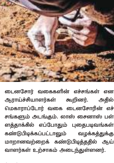
டைனசோர் வகைகளின் எச்சங்கள் என ஆராய்ச்சியாளர்கள் கூறினர். அதில் மெகரார்ப்டேர் வகை டைனசோரின் எச்சங்களும் அடங்கும். லாஸ் சைனாஸ் பள்ளத்தாக்கில் எப்போதும் புதைபடிவங்கள் கண்டுபிடிக்கப்பட்டாலும் வழக்கத்துக்கு மாறானவற்றைக் கண்டுபிடித்ததில் ஆய்வாளர்கள் உற்சாகம் அடைந்துள்ளனர்.

நான்கு வகை டைனசோர்களின் எச்சங்களை விஞ்ஞானிகள் கண்டுபிடித்துள்ளனர். சிலியின் லாஸ் சைனாஸ் பள்ளத்தாக்கில் அவை கண்டுபிடிக்கப்பட்டன. 4 வகை டைனசோர்களின் பற்கள், மண்டை, கட்டு எனும்புகள் கண்டெடுக்கப்பட்டன. அவை சிறிய விலங்குகளைச் சாப்பிட்டு வந்ததாகவும் பெரிய விலங்குகளைக் கொண்டுநின்றதாகவும் ஆய்வாளர்கள் கூறினர். சுமார் 66 முதல் 75 மில்லியன் ஆண்டுகளுக்கு முன் அவை வாழ்ந்ததாகவும் அவர்கள் தெரிவித்தனர். அவை இதற்கு முன் அவ்விடத்தில் அடையாளம் காணாத