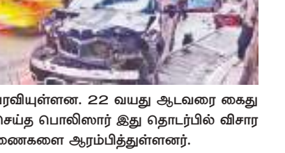
பரவியுள்ளன. 22 வயது ஆடவரை கைது செய்த பொலிஸார் இது தொடர்பில் விசாரணைகளை ஆரம்பித்துள்ளனர். 19 மில்லியன் மக்கள் வசிக்கும் இந்தத் தெற்கு நகரில் கடந்த புதன்சிறுமை (11) பரபரப்பான மாலை நேரத்தில் இந்த சம்பவம் இடம்பெற்றுள்ளது.

சீனாவின் குவான்சுவில் பாதுகாசிகள் மீது கார் வண்டியை செலுத்தி ஐவரை கொன்று மேலும் 17 பேருக்கு காயம் ஏற்படுத்திய சம்பவத்தில் ஆடவர் ஒருவர் கைது செய்யப்பட்டுள்ளார். இந்த சம்பவம் பொதுமக்களிடையே பெரும் கோபத்தை ஏற்படுத்தி இருப்பதோடு அந்த ஆடவர் வேண்டுமென்றே இதனைச் செய்ததாக குற்றச்சாட்டப்பட்டுகிறது.