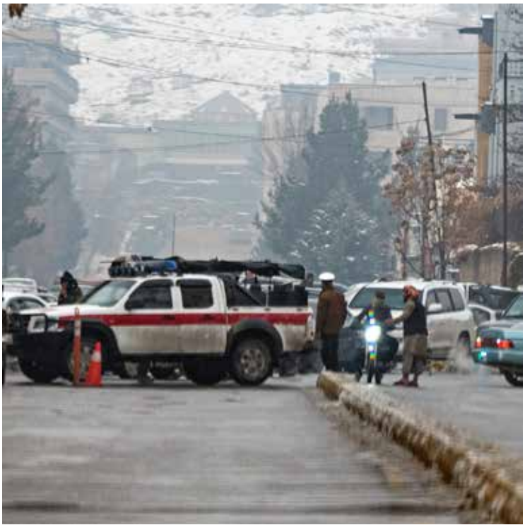
காபூல், ஜன.13 ஆப்கானிஸ்தானின் தலைநகரான காபூல், வெளியுறவுத்துறை அலுவலகம் அருகே நேற்று

முன்நீளம் வெடி குண்டு தாக்குதல் நடந்ததில் 5 பேர் பலியாகியிருந்தனர். இந்த தாக்குதலுக்கு ஐ.எஸ். பயங்கரவாத அமைப்பினர் பொறுப்பேற்று நேற்று அறிக்கை வெளியிட்டு உள்ளனர்.