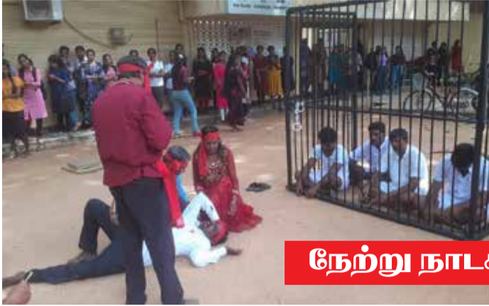
நேற்று நாடக வழுவில்