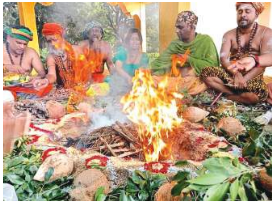
மகாவலிகங்கையில் நீராடி, மரகதலிங்கத்திற்கு அபிஷேகம் செய்தனர்.