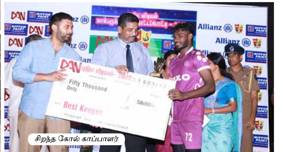
சிறந்த கோல் காப்பாளர்

இப்பத்திரிகை 707, ஆஸ்பத்திரி வீதி, யாழ்ப்பாணம் என்ற முகவரியில் அமைந்துள்ள ஈழநாடு பிறைவேற்ற லிமிட்டெட் நிறுவனத்தினரால் 17.01.2023 அன்று 99 வீதி, நாவற்குழியில் உள்ள ஈழநாடு பிறைவேற்ற லிமிட்டெட் அச்சகத்தில் அச்சிட்டு வெளியிடப்பட்டது.