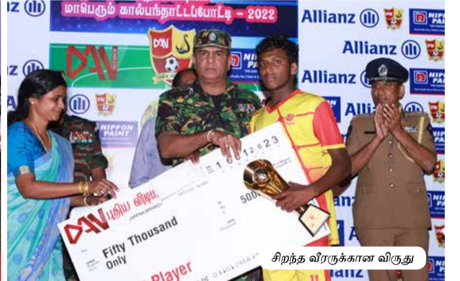
சிறந்த வீரருக்கான விருது