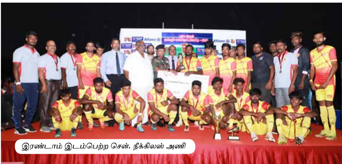
இரண்டாம் இடம்பெற்ற சென். நீக்கிலஸ் அணி