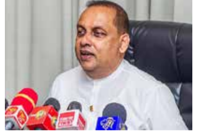
அவருடன் தங்களுக்கு எந்த தனிப்பட்ட பிரச்சனையும் இல்லை எனவும் அமைச்சர் மஹிந்த அமரவீர கூறினார். (அ)

கொழும்பு, ஜன. 17 உள்ளூராட்சி சபைத் தேர்தல் பிற்போடப்படமாட்டாது என விவசாய மற்றும் வனஜீவராசிகள் அமைச்சர் மஹிந்த அமரவீர தெரிவித்தார்.