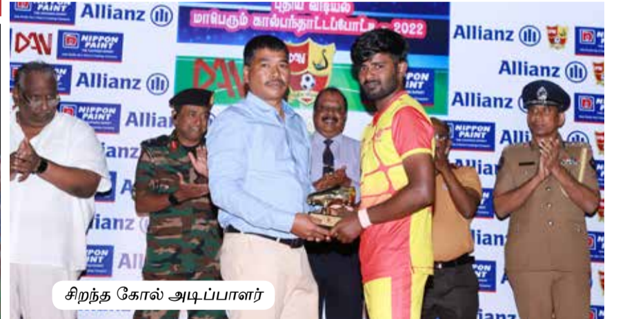
சிறந்த கோல் அடிப்பாளர்