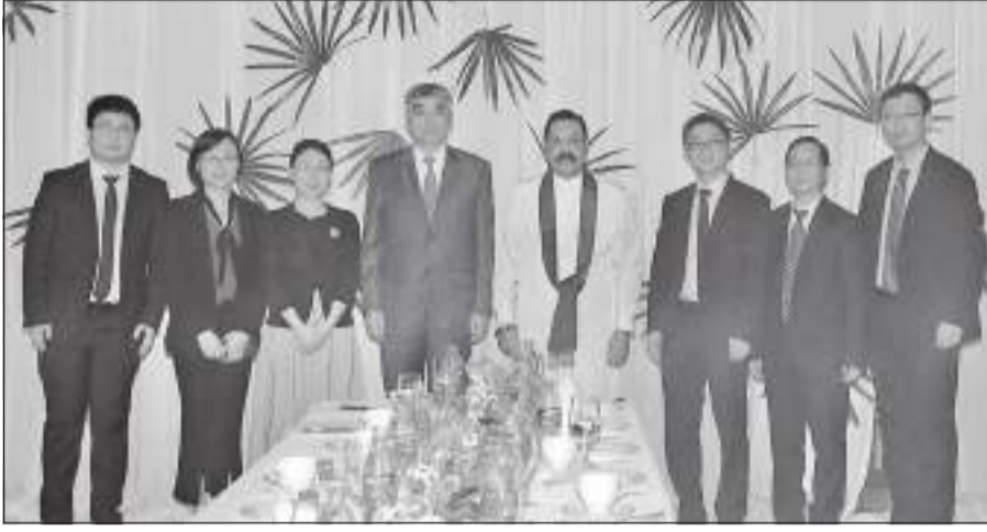
சீன அரசின் சர்வதேசத் துறையின் துணை அமைச்சரும் சீன கம்யூனிஸ்ட் கட்சியின் (CPC) உறுப்பினருமான Chen Zhou, முன்னாள் ஜனாதிபதி மஹிந்த ராஜபக்சேவை (ஜனவரி 15) மாலை சந்திப்போது..