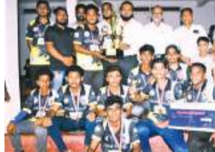
இரண்டாமிடம் பெற்ற சுனாமி சிங்ஸ் மாணவர் அணி

72 ஓட்டங்களை வெற்றி இலக்காகக் கொண்டு களபிறங்கிய, சுனாமி சிங்ஸ் அணியினர் 02 வீக்கட்டுக்களை இழந்து, மொத்தம் 46 ஓட்டங்களை மாத்திரம் பெற்று இரண்டாமிடத்தை பெற்றுக் கொண்டனர். கல்லூரி உதவி அதிபர்கள், ஆசிரியர்கள் மற்றும் சற்றுப் போட்டி அலுவலர்களையுள்ள ஆசிரியர் பரிசளிப்பு நிகழ்வில் அதிதிகளாகக் கலந்துகொண்டு, வெற்றி அணிகள் மற்றும் வெற்றி வீரர்களுக்கான வெற்றிக் கிண்ணம் மற்றும் பரிசில் களை வழங்கி வைத்தனர். இந்நிகழ்வில் மாணவர்கள் ஆசிரியர்களுக்கு பரிசில் வழங்கி சிமீய்ந்தனர்.