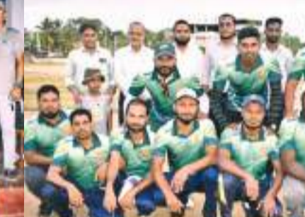
வெற்றியீட்டிய ஆசிரியர் அணியினர்