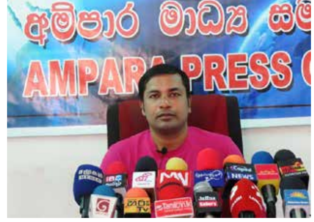
துழைப்பு வழங்க தயாராகவுள்ளேன். - எனக் குறிப்பிட்டார்.

அதில் அரசியல் மற்றும் சட்ட நீதியாகவும் எமக்கு அனுபவம் உள்ளது. எனவே இவ்வாறான சம்பவத்துடன் பொய்யான பிரச்சாரங்கள் மூலம் என்னைத் தொடர்பு படுத்த வேண்டாம். உண்மை நிலையை அறிய வேண்டியவர்கள் எம்மைத் தொடர்பு கொண்டு மக்களுக்கு தெளிவு படுத்த முன்வர வேண்டும். அத்துடன் நான் இச்சம்பவம் இடம்பெற்றபின்னர் தலைமறைவாகினேன் எனத் தெரிவிக்கப்பட்டிருந்தது. அது உண்மைக்கு புறம்பானது. இச்சம்பவத்திற்கு பொலிஸாருக்கு ஒத்த