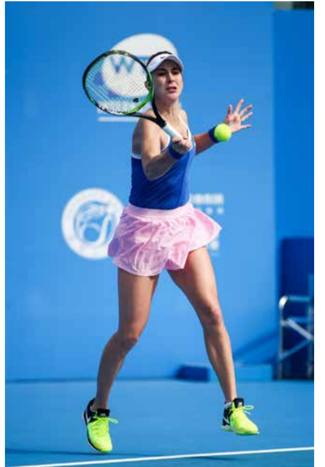
மெல்பர்ன், ஜன. 19

கிராண்ட்ஸ்லாம் என்ற உயரிய அந்தஸ்து பெற்ற அவுஸ்திரேலிய ஓப்பன் ரென்னிஸ் போட்டி மெல்பர்னில் நடைபெற்று வருகிறது.