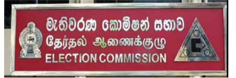
ஆணைக்குழு கடந்த 4ஆம் திகதி அறிவித்திருந்தமை குறிப்பிடத்தக்கது. (அ)

உள்ளூராட்சி மன்றத் தேர்தலுக்கான வேட்புமனுக்களை ஏற்கும் பணி நேற்று முதல் ஆரம்பமாகியுள்ளது. இதற்கமைய நேற்று முதல் எதிர்வரும் 21ஆம் திகதி நண்பகல் 12 மணி வரை வேட்புமனுக்கள் ஏற்றுக்கொள்ளப்படும் என அறிவிக்கப்பட்டுள்ளது. உள்ளூராட்சி மன்றத் தேர்தல் தொடர்பாக, 341 உள்ளூராட்சி மன்றங்களில் 340 மன்றங்களுக்கான வேட்புமனுத் தாக்கல் நேற்று முதல் ஆரம்பிக்கப்படுமென தேர்தல்