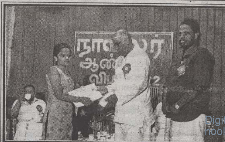
யா/கைதடி கிழக்கு சனசமூக நிலைய இந்து வாலிபர் சங்கம் நடத்திய ஆறுமுகநாவலர் ஆண்டு கடந்த வெள்ளிக் கிழமை கைதடி கிழக்கு சனசமூக அம்பலவாணர் ரூபகார்த்த அரங்கில் இடம்பெற்றது.

டுத்தாத வகையில், உயர் பாதுகாப்பு வலயத்தினுள் இருக்கின்ற காணிகளை விடுவித்தல் மற்றும் பாடசாலை மைதானம் போன்ற பொது இடங்களை புனரமைப்பதற்கு இராணுவத்தினரின் ஒத்துழைப்புக்களை பெற்றுக்கொள்வது தொடர்பாகவும் இச்சந்திப்பில் அமைச்சர் டக்ளஸ் தேவானந்தாவினால் பிரஸ்தாவிக்கப்பட்டது. (நி-6-33)