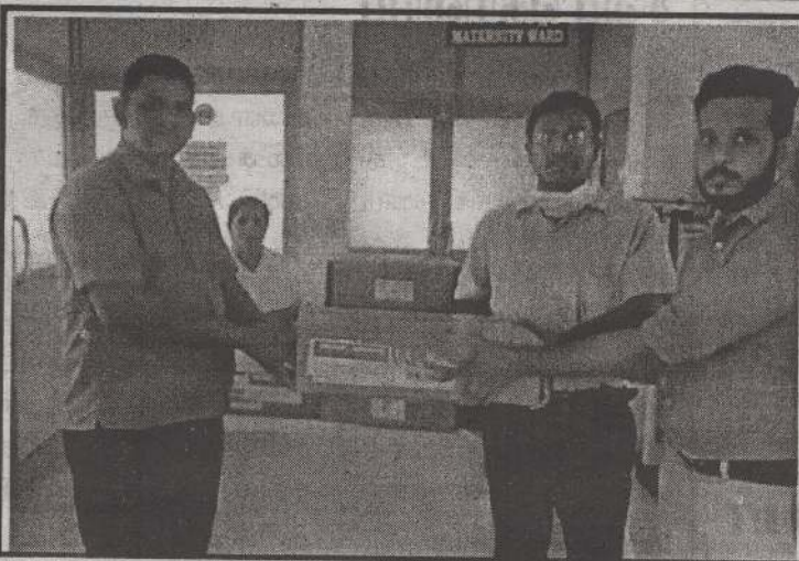
தருமபுரம் பிரதேச மருத்துவமனைக்கு சென்.ஜோன்ஸ் கல்லூரி யாழ்ப்பாணம் பிரித்தானியா பழைய மாணவர்களால் அன்பளிப்பாக சிறுவர்களுக்கான சுமார் 2 இலட்சம் பெறுமதியான மருந்துப் பொருட்கள் தருமபுரம் பொறுப்பு மருத்துவ அதிகாரியிடம் நேற்று முன்தினம் கையளிக்கப்பட்டது.