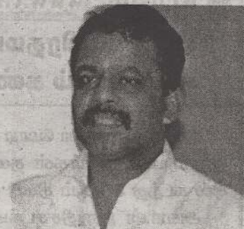
களுக்கு என்ன அருகதை உள்ளது. இன்று ஆயுதம் ஏந்தி போராடியவர்கள் துரோகிகள் என்றால் அவர்களை ஆதரித்த மக்களும் துரோகிகளா? எனக் கேள்வி எழுப்பினார். (நி-6-350)

கட்சியின் வன்னி தலைமை அலுவலகம் திறப்பு விழாவின் போதே மேற்கண்டவாறு தெரிவித்தார். இன்று உள்ள பெரும்பாலான மக்கள் பிரதிநிதிகள் தமிழ் மக்களின் விடுதலைக்காக போராட்டக் காலங்களில் ஒரு துளி வியர்வை சிந்தாதவர்கள். இவர்கள் தான் அன்று வியர்வை சிந்தியவர்களுக்கு, ஆயுதம் ஏந்திபோராடியவர்களுக்கு, துரோகிகள் என்று பட்டம் வழங்குகின்றவர்களாக காணப்படுகின்றனர். துரோகி பட்டம் வழங்குவதற்கு இவர்