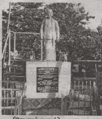
(நெளக்குளம்) வவுனியா நகர மத்தியில் தந்தை செல்வாவின் சிலைக்கு அருகாமையில் இரண்டு கடசி தலைவர்களுக்கு சிலை வைப்ப

பதற்கான கட்டுமானப் பணிகள் இடம்பெற்று வருகின்றது. இரவோடு இரவாக அமைக்கப்பட்ட குறித்த கட்டுமானப் பணி தொடர்பில் வவுனியா நகரசபை தலைவரிடம் கேட்ட போது, ஈ.பி.ஆர்.எல்.எப் கட்சியின் தலைவர் பத்மநாபா மற்றும் புளொட் அமைப்பின் தலைவர் உமாமகேஸ்வரனுக்கு சிலை வைப்பதற்காக குறித்த இடத்தில் கட்டுமான மொன்று அமைக்கப்படுவதாக தெரிவித்ததுடன் அதற்கான அனுமதி வட மாகாண ஆளுநரிடம் பெறப்பட்டதாகவும் தெரி