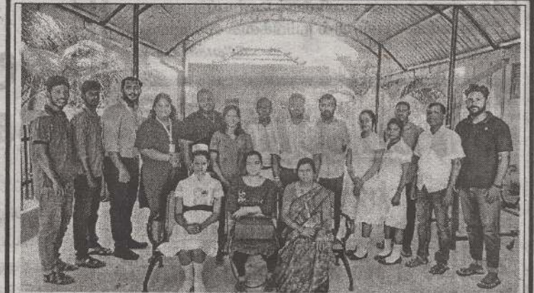
வலிகாமம் வடக்குப் பிரதேச சபை சுகாதார தொழிலாளர்களால் ஒழுங்கமைக்கப்பட்டு நடத்தப்பட்ட இரத்தான முகாம் கடந்த வெள்ளிக்கிழமை வலிகாமம் வடக்கு பிரதேச சபையில் நடைபெற்றது.

இரண்டு ஹெக்டேயருக்கு மேற்பட்ட விவசாயிகளுக்கு 20000 ரூபாய் வீதம் அவர்களின் தனிப்பட்ட வாங்கிக் கணக்கில் கட்டும் கட்டமாக வைப்பில் இடப்படவுள்ளது. அத்துடன் உலக உணவு விவசாய தாபனத்தின் ஏற்பாட்டில் (FAO) US AIDயினால் TSP எனப்படும் அடிக்கட்டுப் பசளையும் வழங்கப்படவுள்ளதாகவும் தெரிவித்தார். (4-6-315-316)