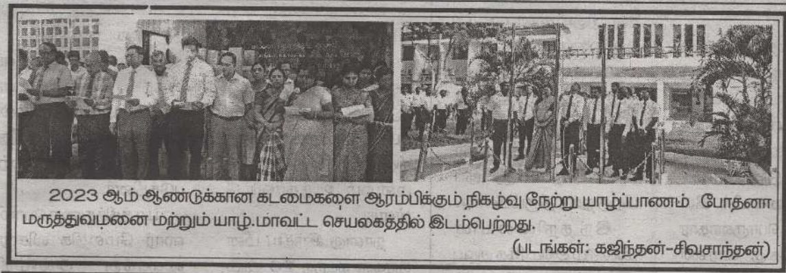
2023 ஆம் ஆண்டுக்கான கடமைகளை ஆரம்பிக்கும் நிகழ்வு நேற்று யாழ்ப்பாணம் போதனாமருத்துவமனை மற்றும் யாழ்.மாவட்ட செயலகத்தில் இடம்பெற்றது.