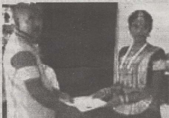
ஊர்காவற்றுறை பிரதேசசபையின் அனலை தீவு பொதுநூலகத்தால் தேசிய வாசிப்பு மாதத்தை முன்னிட்டு நடத்தப்பட்ட போட்டிகளில் வெற்றியீட்டியவர்களுக்கு பரிசில்கள் வழங்கும் நிகழ்வு அண்மையில் பொது நூலக மண்டபத்தில் நடைபெற்றது. (ச-9)