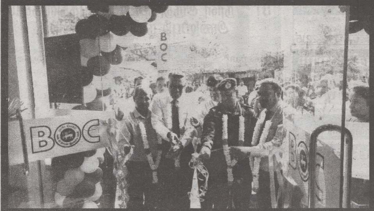
நாட்டில் 1981ஆம் ஆண்டு ஏற்பட்ட யுத்த அனர்த்தத்தின் பின்னர் பூட்டப்பட்டிருந்த, காங்கேசன்துறை இலங்கை வங்கியின் காரியாலயம் நவீனதொழில்நுட்ப வசதிகளுடன் நேற்று திங்கட்கிழமை திறந்துவைக்கப்பட்டது. குறித்த வங்கிக் கிளை திறப்பு நிகழ்வில் இலங்கை வங்கியின் வட பிராந்திய முகாமையாளர், யாழ். மாவட்ட இராணுவ சுட்டளைத் தளபதி, தெல்லிப்பழை பிரதேசசெயலர், வலி. வடக்கு பிரதேச சபை தவிசாளர், பொலிஸ் உயர் அதிகாரிகள் மற்றும் இலங்கை வங்கியின் வங்கி முகாமையாளர் கள் ஆகியோர் கலந்துகொண்டனர். (ய-27)