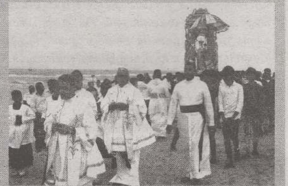
மன்னார், ஜன.10 மன்னார் மறைமாவட்டத்தில் மூவியரசர் பட்டினம் என அழைக்கப்படும் பேசாலையில் மூவியரசர் விழா நேற்றுமுன்தினம் ஞாயிற்றுக்கிழமை இடம்பெற்றது. விழாவின் ஒரு பகுதியாக புனித வெற்றி அன்னையின் திருச்சொருபப் பவனியும் இடம்பெற்றது. வெற்றி அன்னையின் திருச்சொருபம் கடல்நீரால் கழுவப்பட்டு அந்த நீர் கடலுடன் மீண்டும் கலக்கப்பட்டது. அத்துடன், குழந்தைப் பாக்கியம் இல்லாமல் இருப்பவர்களுக்காக குழந்தை இயேசுவின் சிறப்பாசீரும் வழங்கப்பட்டது. (ய-60)