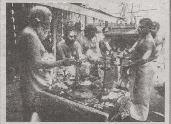
தொண்டைமானாறு சந்நிதியான் ஆச்சிரம சைவ கலை பண்பாட்டுப் பேரவையின் ஏற்பாட்டில் வருடாந்த திருவாசக விழா சந்நிதியான் ஆச்சிரமத்தில் நேற்றுமுன்தினம் ஞாயிற்றுக்கிழமை நடைபெற்றது. (ய-66)