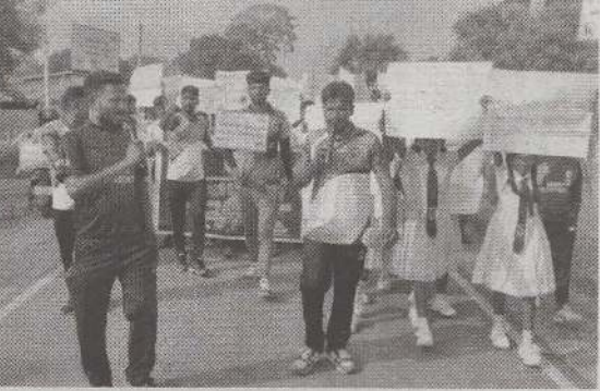
வாக்குமாறு வலியுறுத்தி மாணவர்களால் போராட்டம் முன்னெடுக்கப்பட்டுள்ளது. (ம-14,113)

கூசைப்பிள்ளை சந்தியில் ஆரம்பிக்கப்பட்ட பேரணி, பாரதிபுரம் மத்திய வீதி ஊடாக பாடசாலையை வந்தடைந்து நிறைவுற்றது. அண்மைக்காலமாக உயிர்கொல்லி போதைப்பொருள் இளைஞர், யுவதிகள் உள்ளிட்டோரைக் கடந்து மாணவர்கள் மத்தியில் பெரும் தாக்கத்தைச் செலுத்தியுள்ளது. பல மாணவர்கள் போதைப்பொருளுக்கு அடிமையாகி சீரழிந்து மருத்துவமனைகளில் சிகிச்சை பெற்று புனர்வாழ்வு மையங்களில் சேர்க்கப்பட்டுள்ளனர். இந்த நிலையிலே போதைப்பொருளற்ற கலாசாரத்தை உரு