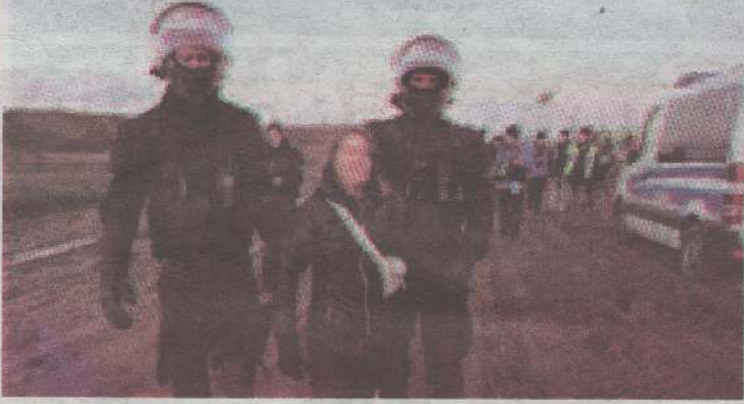
(பெர்லின்) ஜேர்மனியில் போராட்டத்தில் ஈடுபட்ட காலநிலை மாற்ற ஆர்வலர் கிரேட்டா துன்பெர்க் பொலிஸாரினால் கைது செய்யப்பட்டுள்ளார்.

கார்ஜ்வெய்லர் சுரங்கத்தின் விரிவாக்கத்துக்கு எதிர்ப்புத் தெரிவித்து போராட்டத்தில் ஈடுபட்ட நிலையிலேயே இவர் கைது செய்யப்பட்டுள்ளார்.