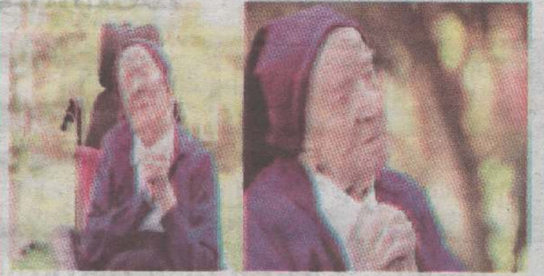
(பாரிஸ்) உலகின் மிக வயதான நபர் நேற்றுக் காலமானார். அருட்சகோதரி லூசில் ரென்டன் என அறியப்பட்ட இக் கன்னியஸ்திரி தனது 118 ஆவது வயதில் நேற்று முன்

தினம் காலமாகியுள்ளார். உலகின் மிக வயதான நபராக இவரை கின்னஸ் சாதனை வெளியீட்டாளர்களும் உத்தியோகபூர்வமாக அறிவித்திருந்தமையும் குறிப்பிடத்தக்கது. (நி)