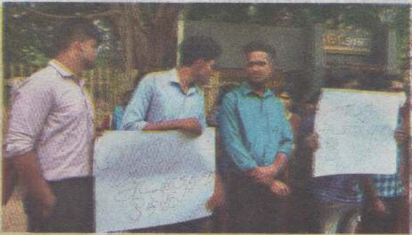
யாழ். பல்கலைக்கழக மாணவர்கள்