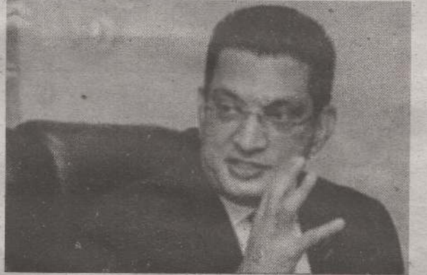
இலங்கை - சீனா உறவுகள் இந்திய நலனைப் பாதிக்காது அலி சப்ரி தெரிவிப்பு

அமெரிக்கா மற்றும் ஏனைய சர்வதேச நிறுவனங்களுடனான கூட்டாண்மை இலங்கையின் பொருளாதார மீட்சி மற்றும் நவீனமயமாக்கலுக்கு முக்கியமாகும். இதன் அடிப்படையில் இலங்கையின் தனியார் துறையுடன் ஒத்துழைப்பதற்கான சாத்தியங்கள் குறித்து விவாதிப்பதற்காக அமெரிக்காவைத் தளமாகக் கொண்ட போயிங் நிறுவனத்தின் மூத்த பிரதிநிதிகளை தாம் சந்தித்தாக தூதுவர் தெரிவித்துள்ளார். ஒரு முன்னணி உலகளாவிய விண்வெளி நிறுவனமாக போயிங் 150 க்கும் மேற்பட்ட நாடுகளில் வாடிக்கையாளர்களுக்கு வணிகவிமானங்கள், பாதுகாப்பு பொருள்கள் மற்றும் விண்வெளிக் கட்டமைப்புகளில் சேவையாற்றி வருகின்றமை குறிப்பிடத்தக்கது. (ம)