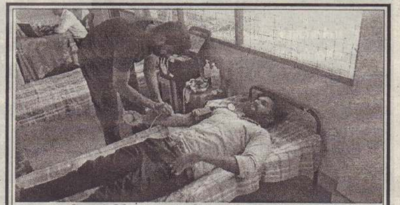
மகா சிவராத்திரியை முன்னிட்டு அகில இலங்கை சைவ மகா சபையினரால் இரத்ததான முகாமொன்று கீரிமலை குழந்தை வேல் சுவாமிகள் அறப்பணி மைய அரங்கில் நேற்றுக்காலை முன்னெடுக்கப்பட்டது.

யாழ். மாநகர சபையின் தீயணைப்பு வாகனம் வரவழைக்கப்பட்டு தீ கட்டுப்பாட்டுக்குள் கொண்டு வரும் நடவடிக்கை முன்னெடுக்கப்பட்டது. (4-6-104)