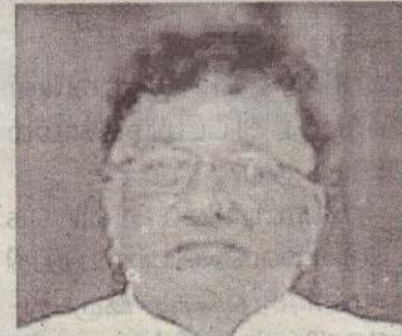
அனைவரும் பேசி இவ்விரு அதிகாரங்கள் தொடர்பில் பொது இணக்கப்பாட்டுக்கு வர வேண்டும்.

அதேபோல் 13 ஆவது திருத்தச் சட்டத்தில் உள்ள பொலிஸ், காணி அதிகாரங்கள் தொடர்பில் சர்ச்சை நிலை காணப்படுகின்றது.