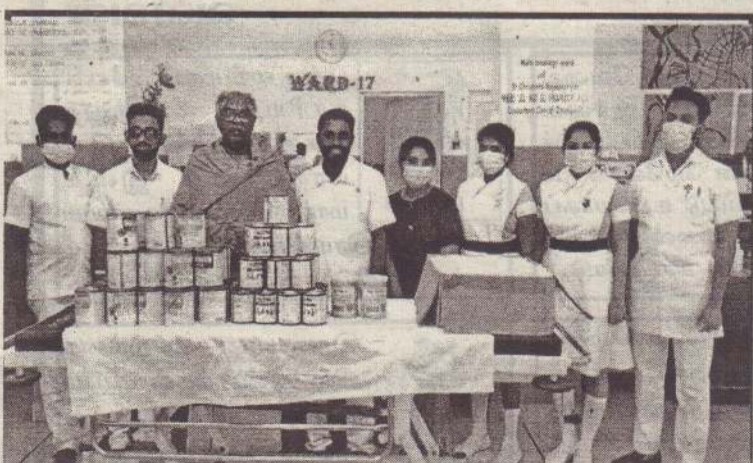
தெல்லிப்பழை மருத்துவமனை புற்றுநோய்ச் சிகிச்சை பிரிவுக்கு சத்துமா வகைகள் சிவபூமி அறக்கட்டளையினால் கடந்த 14 திகதி வழங்கப்பட்டது.

இந்நிலையில் நிலுவையைச் செலுத்தாமல் அனுமதி வழங்குவதில்லை என்றும் மாநகர சபையினால் வழங்கப்படும் சுகாதார சேவைகள் உட்பட நலச்சேவைகள் எதனையும் வழங்குவதில்லை எனவும் சபையில் ஏகமனதாக முடிவு செய்யப்பட்டுள்ளது. (4-6-104)