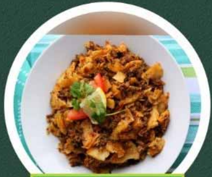
Kipling & Steeles

UNIT 2 - 2002 MIDDLEFIELD RD MARKHAM, ON L3S 1Y5