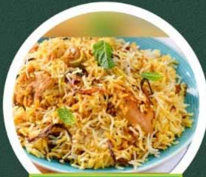
Middlefield & Steeles

UNITS 105 & 106 - 2900 WARDEN AVE, SCARBOROUGH, ON M1W 2S8