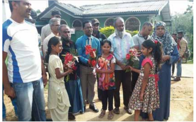
எதிர்ப்பார்க்கப்படுகின்றது. இறைவன் பதில் தருவான்.