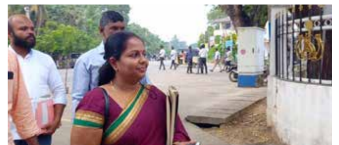
யாழ்ப்பாணம், ஜன. 22

ஐக்கிய மக்கள் சக்தி உள்ளூராட்சிமன்ற தேர்தலுக்கான வேட்புமனுவை நேற்று யாழ்ப்பாணத்தில் தாக்கல் செய்தது.