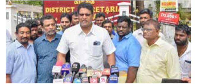
யாழ்ப்பாணம், ஜன. 22

உள்ளூராட்சி மன்றத் தேர்தலுக்கான வேட்புமனுவை பாராளுமன்ற உறுப்பினர் சி.வி.விக்கேன்வரன் தலைமையிலான தமிழ் மக்கள் கூட்டணி நேற்று யாழ்ப்பாணத்தில் தாக்கல் செய்தது.