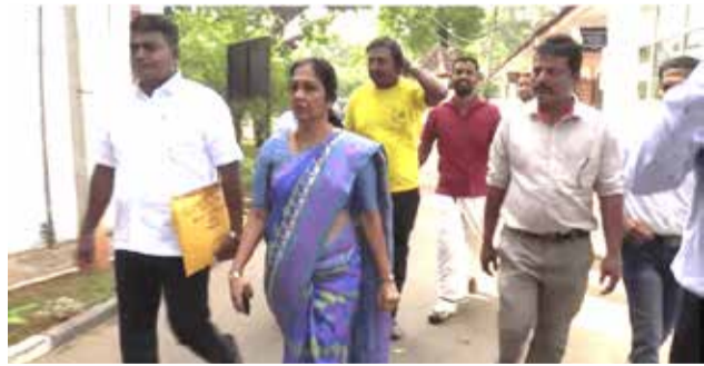
யாழ்ப்பாணம், ஜன. 22

உள்ளூராட்சி மன்றத் தேர்தலுக்கான வேட்புமனுவை ஐக்கிய தேசிய கட்சி நேற்று யாழ்ப்பாணத்தில் தாக்கல் செய்தது.