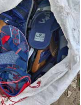
யாழ்ப்பாணம், ஜன. 22 இலங்கைக்கு கடத்தும் நோக்கில் தமிழகம் தனுஸ்கோடி