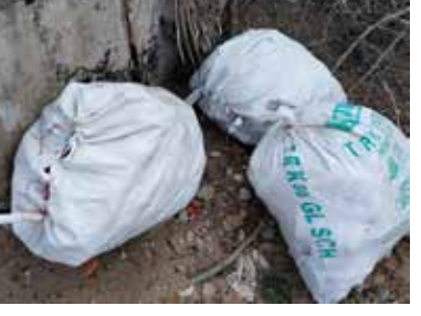
கடற்கரையில் மறைத்து வைக்கப்பட்டிருந்த பெருமளவு பாதணிகளை தமிழகப் பொலி சார் மீட்டுள்ளனர். தமிழகம் இராமேஸ்வரம் மாவட்டம் தனுஸ்கோடி கடற் கரையில் நேற்று இரவு 7.30 மணியளவில் பொலிசார்