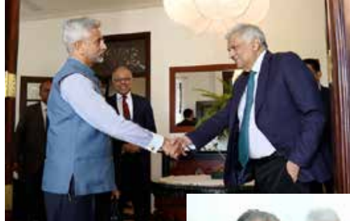
அரசியல் நடத்தியதுதான் இந்த இக்கட்டு நிலைமைக்குக் காரணம்.

தமிழ் மக்களின் இன்றுவரையான அரசியல் தலைவர்கள், தங்களது நலன்களே முக்கியமென முடிவுகளை முக்கிய தருணங்களில், தமிழீழத்திற்காகவோ, தமிழ் தேசத்துக்காகவோ