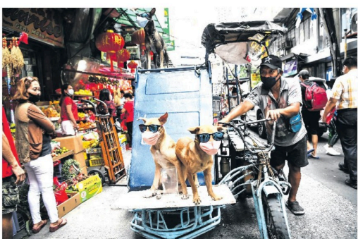
பிலிப்பைன்ஸின் சீன பாரம்பரிய லூனார் புத்தாண்டுக் கொண்டாட்டங்கள் களைக்கட்டியுள்ள நிலையில் மணிலா வீதியில் தனது ஏழாமாடகடன் 'மால்சு' அணிந்தபடி மாஸாக உலா வந்த நாங்கள்...

நேற்றுக் காலை 7.34 மணிக்கு இந்த சிக்கல் ஏற்பட்டதாகவும், இதனால், நாடு முழுவதும் மின்சார விநியோகம் பாதிக்கப்பட்டிருப்பதாகவும், கிணராக இணை சரிமெயும் பணிகள் நடைபெற்று வருவதாகவும், எளிமில், 12 மணிநேரம் ஆகவும் என்றும் அங்கிருந்து வரும் தலைவர்கள் தெரிவிக்கின்றனர்.