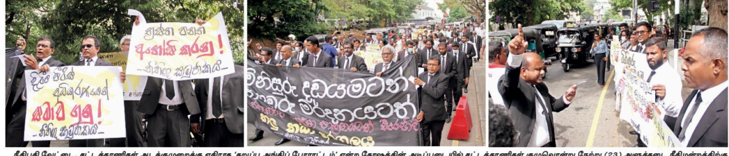
நீதிபதி வேட்டை, சட்டத்தரணிகள் அடக்குமுறைக்கு எதிராக 'ஹப்பு அம்மி' போராட்டம் என்ற கோஷத்தின் அடிப்படையில் சட்டத்தரணிகள் குடிவொன்று நேற்று (23) அருககடை நீதிமன்றத்திற்கு முன்பாக உணவுப் பான போராட்டத்தை நடத்தியது. இதன்போது சட்டத்தரணிகள் அருககடை நீதிமன்ற வளைத்ததை சந்தி ஊர்வலமாக சென்று நீதிமன்றங்களுக்கு முன்பாக ஆய்விட்டதில் ஈடுபட்டனர்.

தம்புள்ளையில் வீசப்படும் குப்பைகளில் இருந்து கரிம உரங்களை உற்பத்தி செய்வது முறை குறித்து ஆராய்வதற்கான திட்டம் நடைமுறைக்கு இடம் பெற்று வந்ததற்கான குடிவொன்று தம்புள்ளையில் வந்தது. இந்திய, டிராய் நிறுவனங்களின் ஒத்துழைப்பில் திட்டமாக 5 ஏக்கரில் தம்புள்ளை மரநாற் சபையால் நிர்மணிக்க உத்தேசிக்கப்பட்டுள்ள கரிம உரத்திட்டம் மற்றும் தம்புள்ளையில் ஆராய்ச்சிக்கப்பட்ட பான்டர் ஸ்பளிக் செய்கையை இந்தக் குழு பார்வையிட்டது. இந்தியாவின் ஹைடிரோபாத்தி வசிக்லும் பிரபல தொழிலதிபர் ராம் சுப்ரானியன் மற்றும் டிராய்ஸ் சேர்ந்த இரண்டு தொழிலதிபர்களான அலகு அல்