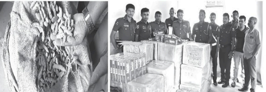
சந்தேக சந்தேகப்பார்கள் கடந்த வெள்ளிக்கிழமை வெள்ளிக்கிழமை நீதிமன்றத்தில் முன்வைப்பட்டுள்ளனர். மதுப்பாடு போலீஸின் மேலதிக விசாரணைகளை முன்னெடுத்து வருவதாக பொலிஸ் ஊடகப்பிரிவு மேலும் தெரிவித்துள்ளது.

சங்க வரி செலுத்தாமல் சட்டவிரோதமாக நாட்டுக்கு கொண்டுவரப்பட்ட மஞ்சள் கொக மற்றும் சிகரெட்டுகளுடன் சந்தேகப்பார்கள் மூவர் கைது செய்யப்பட்டு விசக்மரியலில் வைக்கப்பட்டுள்ளதாக பொலிஸ் ஊடகப்பிரிவு தெரிவித்துள்ளது. கடந்த வெள்ளிக்கிழமை மதுப்பாடு போலீஸ் நிலையத்திற்கு மீட்கப்பட்ட பெற்ற தகவல்களையே மேற்கொள்ளப்பட்ட கறி வளைப்பில் கொள்வனவு செய்யப்பட்ட களஞ்சியப்படுத்தி வைக்கப்பட்டிருந்த நிலையில் 12,250 கிலோ கிராம் மஞ்சளுடன் 3 சந்தேகப்பார்களை கைதுசெய்யப்பட்டுள்ளனர்.