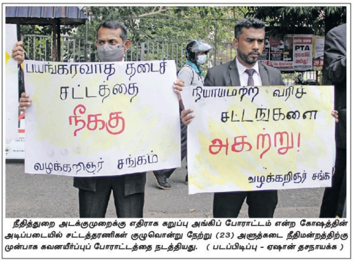
நீதித்துறை அடக்குமுறைக்கு எதிராக கறுப்பு அங்கிப் போர்ட்டம் என்ற கோஷத்தின் அடிப்படையில் சட்டத்தரணிகள் குழுவொன்று நேற்று (23) அருத்தகடை நீதிமன்றத்திற்கு முன்பாக கவையிப்புப் போர்ட்டத்தை நடத்தியது.