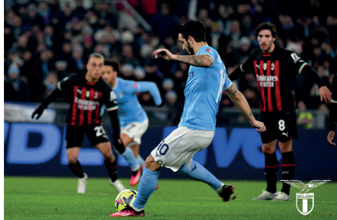
இத்தாலிய சீரி ஏ தொடர்: நடப்புச் சம்பியன்களை வென்ற டாஸ்காட் போட்டி