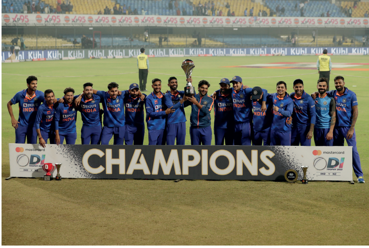
ஒருநாள் சர்வதேசப் போட்டிகளுக்கான தரவரிசையில்