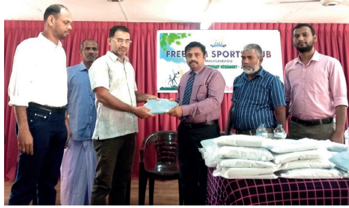
மாணிக்கக்காடு பிரிடம் விளையாட்டுக் கழகத்தின் சீருடை அறிமுகம்

ஜேர்மனியக் கால்பந்தாட்டக் கழகங்களுக்கிடையிலான புண்டெஸ்டிக்கா தொடரில், தமது மைதானத்தில் நேற்று அதிகாலை நடைபெற்ற எஃப். சி கொலோனாடனான போட்டியை 1-1 என்ற கோல் கணக்கில் நடப்புச் சம்பியன்களான பரேர்ஸ் மியூனிச் சமப்படுத்தியது. அந்தவகையில், புண்டெஸ்டிக்கா புள்ளிகள் பட்டியலில் 36 புள்ளிகளுடன் முதலாமிடத்தில் மியூனிச் உள்ளது. 32 புள்ளிகளுடன் இரண்டாமிடத்தில் ஆர். பி லெய்ப்சுரிக்கும், தலா 30 புள்ளிகளைப் பெற்றுள்ளபோதும் கோலெண்ணிக்கை வித்தியாசத்தில் ஐன்ரீட்ச் பிராங்க்கூப்பேர்ட் மூன்றாமிடத்தில், யூனியன் பேர்லின் நான்காமிடத்தில், பெர்லினும் ஒரு போட்டி குறைவாக விளையாடியுள்ளன.