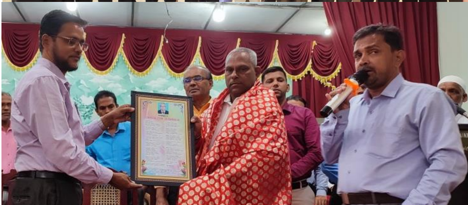
ஆகியோரும் நினைவுச் சின்னம் வழங்கி கௌரவிக்கப்பட்டார்கள்.