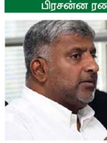
உள்ளூராட்சி தேர்தலின் பின்னர் மாகாண சபைத் தேர்தலை நடத்த எதிர்பார்க்கப்படுவது

தாக அமைச்சர் பிரசன்ன ரணதுங்க தெரிவித்துள்ளார். எதிர்வரும் உள்ளூராட்சி மன்றத் தேர்தலுக்காக ஸ்ரீலங்கா பொதுஜன பெரமுனவால் கம் பஹாமாவட்டத்துக்கான வேட்புமனுத் தாக்கல் செய்யும் நிகழ்வில் கலந்து கொண்டதன் பின்னர் ஊடகங்களுக்குக் கருத்து வெளியிடும் போதே அவர் இவ்வாறு குறிப்பிட்டுள்ளார். தேர்தலை ஒத்திவைப்பதற்கான அலுவலகத்திலிருந்து துவக்காகவே வேட்புமனு கோரப்பட்டுள்ளது எனவும் அவர் தெரிவித்துள்ளார்.