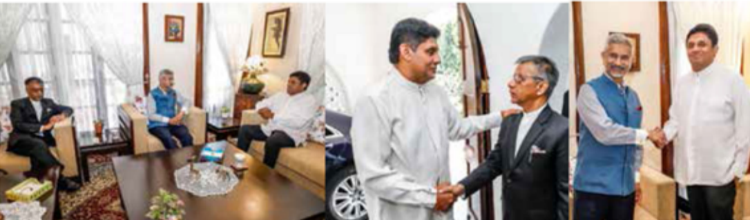
இந்திய வெளிவிவகார அமைச்சர் கலாநிதி எஸ்.ஜெயசங்கர், எதிர்க்கட்சித் தலைவர் சஜித் பிரேமதாஸவையும் இன்று சந்தித்தார்.