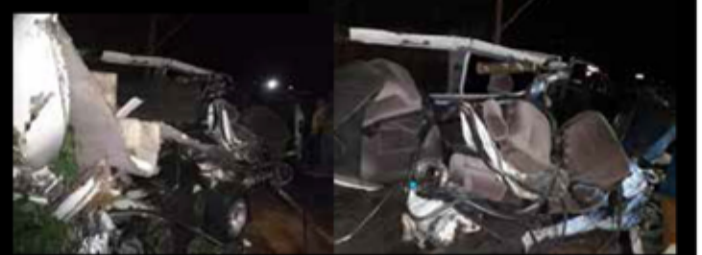
நுவரெலியா மாவட்டம், நானுலுயா - ரதல்ல குறுக்கு வீதியின் சமர் செட பகுதியில் பஸ் ஒன்றும் வான் ஒன்றும் நேற்று மாலை நேருக்கு நேர் மோதி விபத்துள்ளானது. இதில் வானில் பயணித்த 7 பேர் சம்பவ இடத்திலேயே உயிரிழந்துள்ளனர்.