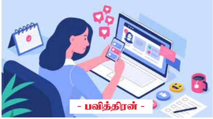
- பவித்திரன் -

சர்வதேச ரீதியாக ஒவ்வோர் ஆண்டும் சமூக வலைத்தளங்களின் வளர்ச்சி அதிகரித்துக்கொண்டே செல்கிறது. வெறும் பொழுதுபோக்கு அம்சமாகப் பார்க்கப்பட்ட சமூக வலைத்தளங்கள், இன்று வருவாய் வாய்ப்பை ஏற்படுத்தித் தரும் அளவுக்குப் பெரும் வளர்ச்சியைப் பெற்றிருக்கின்றன. இன்றைய வாழ்க்கையில் தவிர்க்கமுடியாத ஒரு அம்சமாகவும் சமூக ஊடகங்கள் மாறிவிட்டன. வர்த்த நோக்கத்துடனான சமூக ஊடகங்கள், கல்வி வளர்ச்சி என பல தேவைகளுக்காக இன்று சமூக ஊடகங்களின் பரப்பு விரிவடைந்துகொண்டே செல்கின்றது. இதனால், சமூக ஊடகங்கள் குறித்த கல்வியும் வேலைவாய்ப்புக்களைப் பெற்றுக்கொள்வதற்கு அவசியமானதாகியிருக்கின்றது.