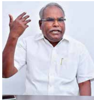
சென்னை, ஜன. 28