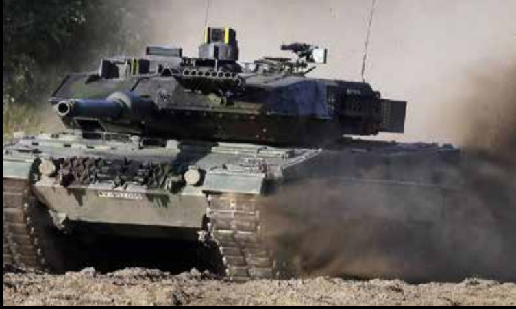
மொஸ்கோ, ஜன. 28 வியன்னாவில் இராணுவப் பாதுகாப்பு மற்றும் ஆயுதக் கட்டுப்பாடு பற்றிய பேச்சு