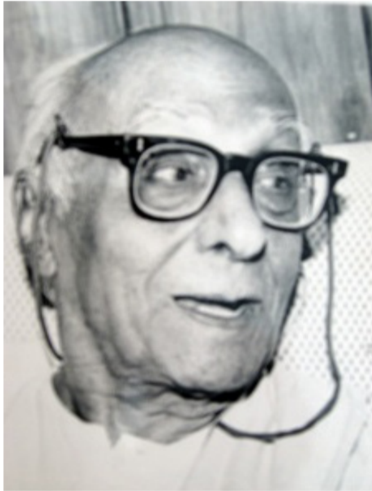
பத்திரிக்கை உலக ஜாம்பவான் மற்றும் விடு

தலைப் போராட்ட வீரரான ஏ. என். சிவராமன் 1904 ஆம் ஆண்டு மார்ச் 1 ஆம் தேதி கேரள மாநிலம் கொச்சினில் பிறந்தார்.