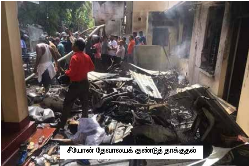
சீயோன் தேவாலயக் குண்டுத் தாக்குதல்

அடக்குமுறைகளுக்கு அடியாளர்களானார்களா என்பதை சமூகம் உற்று நோக்க வேண்டும். வட்டத்தை செய்ய வேண்டிய நிலையில் இருப்பவர்கள், எப்படி அதிகாரத்தில் ஆணித்தரத்துடன் பங்கு எதுவும் கேட்டு இனத்திற்கான நன்மையை தேடித் தரக் கூடும்? தொடர்ந்து பார்ப்போம்.