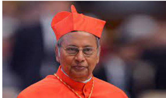
கத்தோலிக்க மக்கள் நீதிக்காக போராடவேண்டும்

டும் என காத்தினால் மல்கம்; ரஞ்சித் வேண்டுகோள் விடுத்துள்ளார். இன்றைய திருச்சபைக்கு தியாகம் செய்யும் கத்தோலிக்கர்கள் தேவையில்லை நீதிக்காக போராடும் பாமரமக்களே தேவை என காத்தினால் தெரிவித்துள்ளார். பொரளையில் இடம்பெற்ற நிகழ்வொன்றில் அவர் இதனைத் தெரிவித்துள்ளார். திருச்சபையின் பார்வையை நாங்கள் மாற்ற வேண்டும் எங்களுக்கு இனிமேல் தியாகம் செய்யும் கத்தோலிக்கர்கள் தேவையில்லை. சமூகத்தின் உரிமைக்காக வீதிக்கு இறங்கி நீதிக்காக போராடும் கத்தோலிக்கர்களே தேவை என அவர் தெரிவித்துள்ளார்.