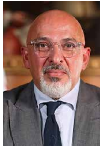
அமைச்சரை பதவி நீக்கினார் பிரி.பிரதமர்

தனது அமைச்சரவையிலிருந்து அமைச்சர் ஒருவரை பதவி நீக்கியிருக்கிறார் பிரிட்டிஷ் பிரதமர் ரிஷி சுனக். கன்சாவேட்டில் கட்சியின் தலைவா நாதீம் ஸகாவியே பதவி நீக்கப்பட்டுள்ளார். அவரது நிதிச் செயல்பாடுகள் தொடர்பாக நடத்தப்பட்ட விசாரணையின் அடிப்படையில் இந்த நடவடிக்கை எடுக்கப்பட்டதாக அறிவிக்கப்பட்டிருக்கிறது.