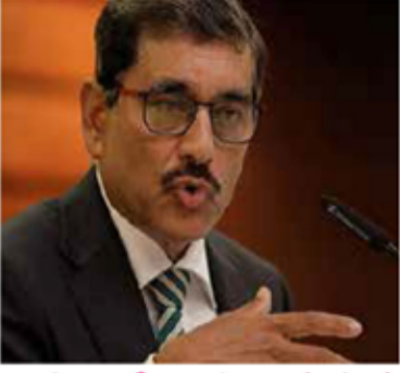
கடன் மறுசீரமைப்பு பேச்சுக்கள் 6 மாதங்களில் நிறைவடையும்! நந்தலால் வீரசிங்க சுவாமிநாதன்

அடுத்த 6 மாதங்களில் கடன் மறுசீரமைப்பு பேச்சுக்கள் நிறைவடையும் என நம்புவதாக மத்திய வங்கியின் ஆளுநர் கலாநிதி நந்தலால் வீரசிங்க சுவாமிநாதன் தெரிவித்துள்ளார். இதேவேளை பெற்றுக்கொள்ளப்பட்ட கடன்களை மீள செலுத்துவோம் என்றும் அதற்காக அர்ப்பணிப்புடன் செயற்படுவதாகவும் கூறியுள்ளார். இலங்கையின் கடன் மறுசீரமைப்பு திட்டத்திற்கு இந்தியா ஆதரவளிப்பதாக சர்வதேச நாணய நிதியம் தெரிவித்துள்ள நிலையில் அவர் இவ்வாறு குறிப்பிட்டுள்ளார்.