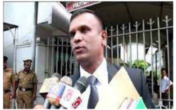
45 ஆயிரம் ரூபாவுக்கும் மேல் வருமானம் ஈட்டுபவர்களிடமும் வரி விதிக்க பரிந்துரை! சர்வதேச நாணய நிதியம் விடுத்தது என்கிறார் பந்துல