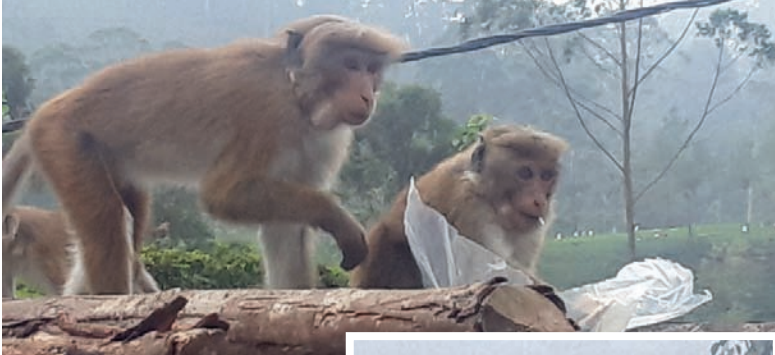
குரங்குகள் தொங்கி விளையாடுவதால் மின் இணைப்பும் இடைக்கிடையே துண்டிக்கப்படுவதாகவும் தெரிவித்துள்ள மக்கள், பொதுமக்களின் நலன் கருதி, குரங்குகளைக் கட்டுப்படுத்த வனஜீவராசிகள் திணைக்கள அதிகாரிகள் உரிய நடவடிக்கை எடுக்குமாறும் தோட்ட மக்கள் கோரிக்கை விடுக்கின்றனர்.

சுவாமிநாதன் அக்கரப்பத்தனை பிரதான நகரத்தில் உள்ள குரங்குகள் ஆக்ரோவா தோட்ட குடியிருப்பு பகுதிக்கு வருவதால் மக்கள் பெரும் சிரமத்தை எதிர்கொள்ள வேண்டிய நிலை ஏற்பட்டுள்ளது. இவ்வாறு வரும் குரங்குகள் வீடுகளில் வைக்கப்பட்டுள்ள உணவு பண்டங்களை உண்பதுடன், விவசாய பயிர்கள் அனைத்தையும் நாசப்படுத்தி வருவதாகவும் தெரிவிக்கின்றனர். மேலும் குடியிருப்பு பகுதியில் கூரைகள் மீது குரங்குகள் தாவி அங்கும் இங்கும் ஓடி திரிவதால், கூரைத்தகடுகள் சேதமாவதாகவும் வீடுகளில் தனியாக சிறு பிள்ளைகளை விட்டு செல்ல முடியாத நிலை ஏற்பட்டுள்ளதாகவும் தெரிவிக்கின்றனர். மின்சார கம்பங்களில்