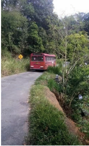
ஏற்படுவதற்கு முன்னர் இந்த மதிசை அமைத்து தருமாறு வேண்டுகோள் விடுக்கின்றனர்.