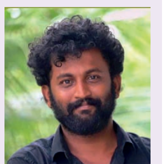
பிரதான தபாலகத்திற்கு அருகாமையில் குறித்த நிகழ்வு நேற்று (31) முன்னெடுக்கப்பட்டது.