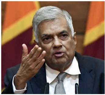
நலன்புரி, மருந்துகள், கடன் கொடுப்பனவுகள் தவிர்ந்த, ஏனைய அனைத்துச் செலவுகளையும் தற்போது திறைசேரிக்கு ஏற்புது கடினம் எனவும் ஜனாதிபதி மேலும் சுட்டிக்காட்டினார்.

2023ஆம் ஆண்டு ஜனவரி மாதத்துக்கான மாதாந்த செலவினத்தை விட அரசாங்கத்தின் வருமானம் தற்போது மிகவும் குறைவாக இருப்பதால் அரசு செலவினங்களை மேலும் குறைக்க வேண்டும் என்று நிதி, பொருளாதார ஸ்திரிப்படுத்தல் மற்றும் தேசிய கொள்கை அமைச்சர் என்ற வகையில் ஜனாதிபதி ரணில் விக்கிரமசிங்க அமைச்சரவைக் குறிப்பில் சுட்டிக்காட்டியுள்ளார். அரசு ஊழியர்களின் சம்பளம், ஓய்வூதியம்,