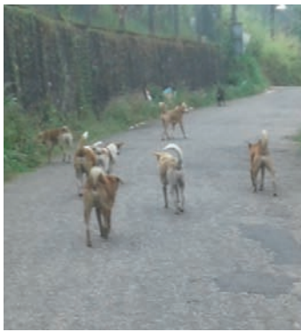
ஹட்டனில் கட்டாக்காலி நாய்களின் பெருக்கத்தைக் குறைக்க சம்பந்தப்பட்ட அதிகாரிகள் நடவடிக்கை எடுக்க வேண்டுமெனவும் பிரதேசவாசிகள் கோரிக்கை விடுக்கின்றனர்.

சுதந்தன்.எம்.ஹோவா ஹட்டனில் கட்டாக்காலி நாய்களின் பெருக்கம் அதிகரித்துள்ளதென பிரதேசவாசிகள் தெரிவிக்கின்றனர். குறித்த கட்டாக்காலி நாய்கள் ஹட்டன் பிரதேசத்தின் அனைத்து பகுதிகளிலும் அதிகரித்து காணப்படுவதாகவும் இதனால் பலரும் அசௌகரியத்துக்கு உள்ளாவதாகவும் உள்ளவதாகவும் தெரிவிக்கின்றனர். கூட்டம் கூட்டமாக கட்டாக்காலி நாய்கள் சுற்றித் திரிவதாகவும் வீதியில் நடந்து செல்பவர்களும் நாய் கடிக்க உள்ளவதாகவும் எனவே,