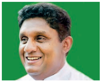
வேட்பாளர்களுடன் சர்வமத்த தலைவர்களிடமும் செவ்வாய்க்கிழமை (31) ஆசி பெற்று தேர்தல் பிரசாரத்தை ஆரம்பித்து வைத்த போதே அவர் மேற்கண்டவாறு தெரிவித்தார்.