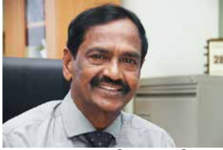
கொழும்பு, பெப். 02