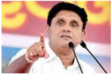
டன் மதத் தலைவர்களிடமும் ஆசி பெற்று தேர்தல் பிரசார

கொழும்பு, பெப். 02 தேர்தல் காலத்தில் தேர்தல்கள் ஆணைக்குழுவின் வெற்றிடங்களுக்கு விண்ணப்பம் கோருவது சட்டவிரோதமானது என எதிர்க்கட்சித் தலைவர் சஜித் பிரேமதாஸ கொழும்பில் தெரிவித்துள்ளார். முஜிபுர் ரஹ்மான் உள்ளிட்ட ஏனைய வேட்பாளர்களு