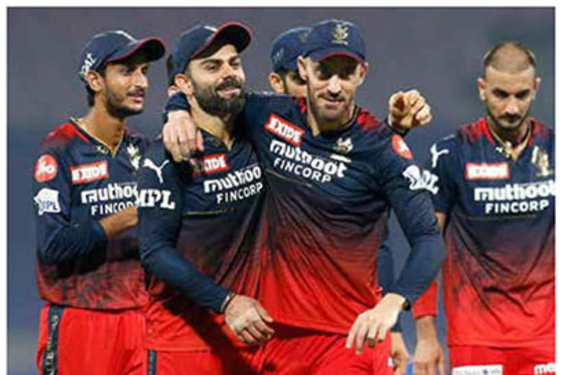
முறை ஐபிஎல் இறுதிப் போட்டியில் விளையாடி

மகளிர் ப்ரீமியர் லீக் தொடரிலும் தனது மகளிர் அணியைக் களமிக் கவுள்ளது ஆர்சிபி. அதனால் இன்ஸ்டாவில் மேலும் பிரபலம்