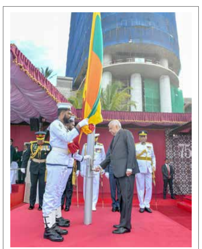
நாட்டின் 75ஆவது சுதந்திர தினமான நேற்று ஜனாதிபதி ரணில் விக்கிரமசிங்க நேற்று தேசியக் கொடியை ஏற்றிவைத்தபோது...! 19

கொழும்பு, பெப். 05 நாட்டின் 75ஆவது சுதந்திர தினமான நேற்று தேசிய கொண் டாட்ட விழாவில் தமிழிலும் தேசிய கீதம் இசைக்கப்பட்டது. 75ஆவது சுதந்திர தினத்தின் பிரதான நிகழ்வு நேற்று காலி முகத்திடலில் கொண் டாட்டப்பட்டது. இந்த நிகழ்வின் நிறைவில் கொழும்பு இராமநாதன் இந்து மகலிர் கல்லூரி, கொழும்பு முஸ்லிம் மகலிர் வித்தியாலயம், கொழும்பு ரோயல் கல் லூரி, வத்தளை புனித அன்ரனி 19