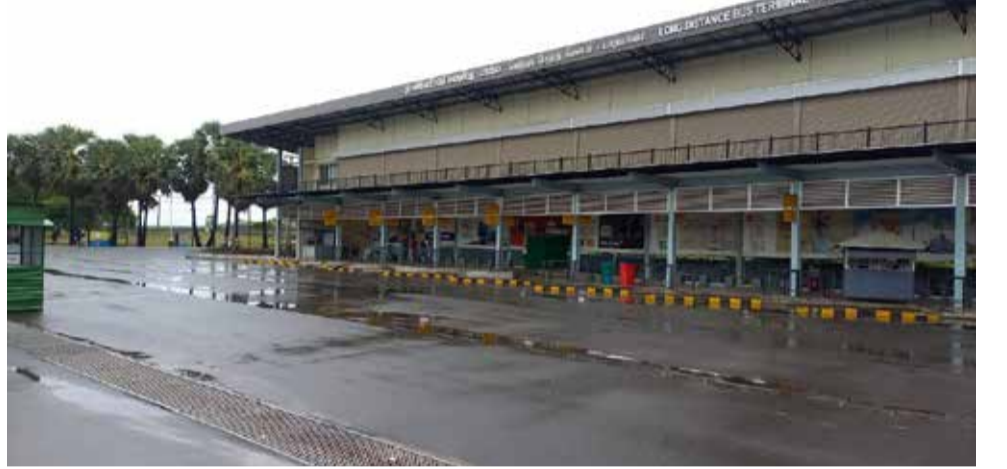
சுதந்திர தினத்துக்கு எதிர்ப்பு தெரிவித்து யாழ்ப்பாணத்தில் நேற்று பூரண கடையடைப்பு போராட்டம் நடைபெற்றது.