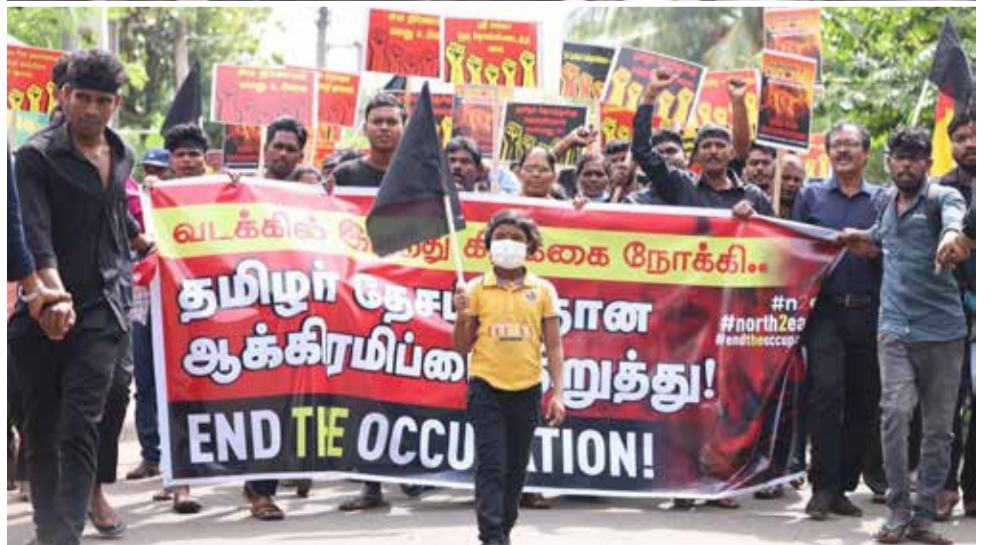
சுதந்திர தினத்துக்கு எதிர்ப்பு தெரிவித்து யாழ். பல்கலைக்கழக மாணவர்களின் ஏற்பாட்டில் நேற்று மட்டக்களப்பு நோக்கி ஆரம்பமான பேரணியின் பதிவுகள்...!