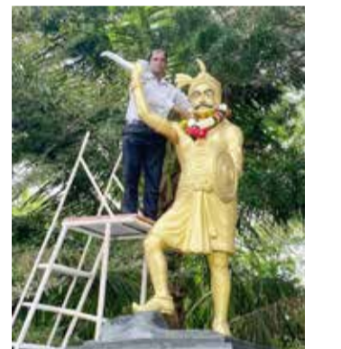
பிரதேச செயலக உத்தியோகத்தர்கள் என பலரும் கலந்து கொண்டனர். (ஐ)