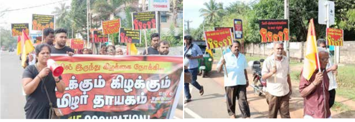
சுதந்திர தினம் கரிநாள்