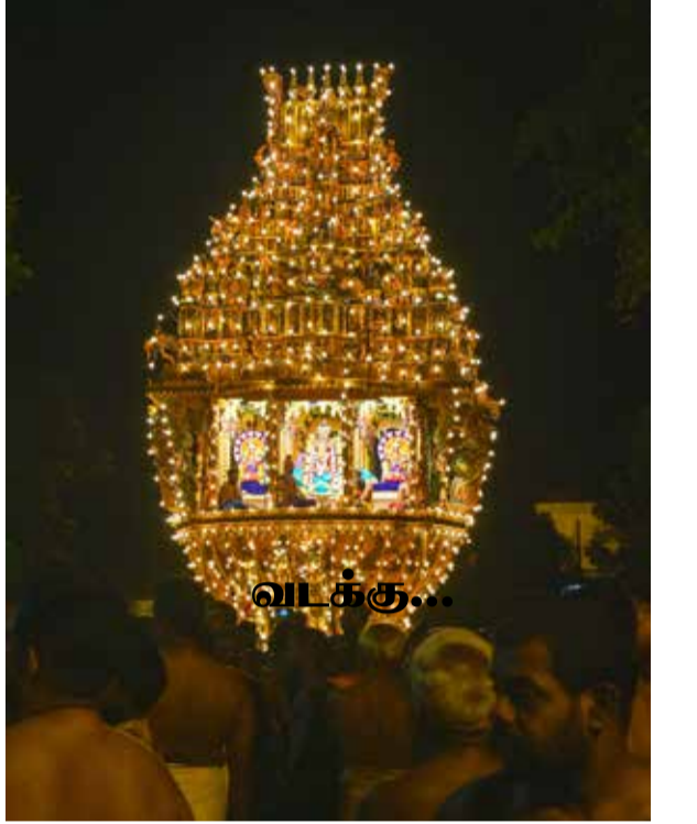
தைப்பூச நன்னாளான நேற்று உலகப் பெருமஞ்சம் என்று சிறப்பிக்கப்படும் திருமஞ்சத்தில் இணுவில் கந்தன் ஆலய கந்தப்பெருமான் வலம்வந்து பக்தர்களுக்கு அருள்பாலித்தார்.