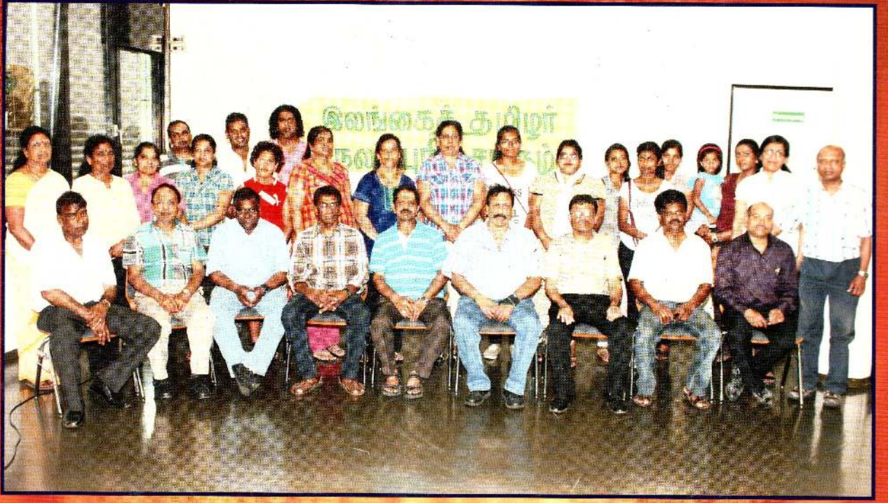
இலங்கைத்தமிழர் நலன்புரிச்சங்கத்தின் 25வது ஆண்டுவிழா சம்பந்தமாக 27.07.2013 அன்று Haus Ennepetal மண்டபத்தில் நடைபெற்ற கலந்துரையாடலில் பங்கு கொண்டோர்.