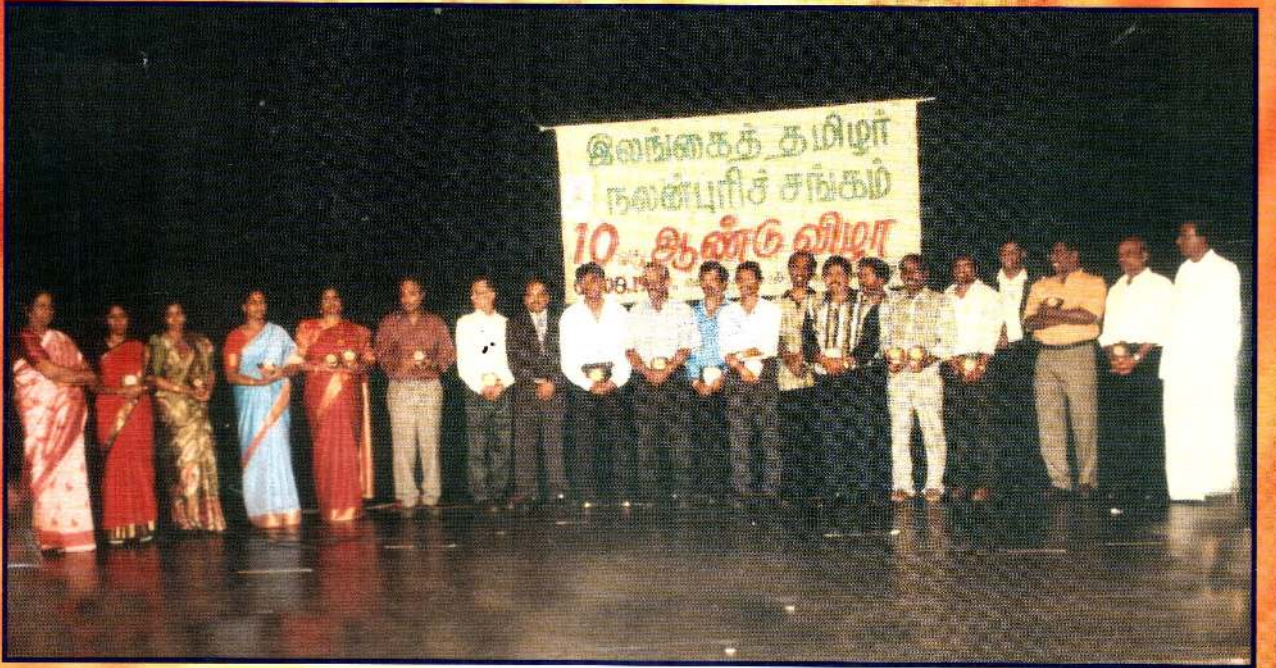
இலங்கைத்தமிழர் நலன்புரிச்சங்கத்தின் 10வது ஆண்டுவிழா 07.08.1999 அன்று Aula Reichenbach Gymnasium மண்டபத்தில் நடைபெற்றபோது.....