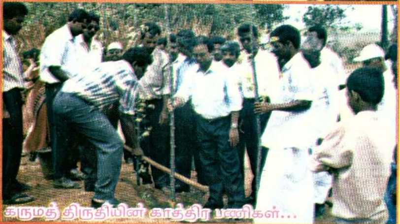
கருமத் திருதியின் காத்திர பணிகள்...