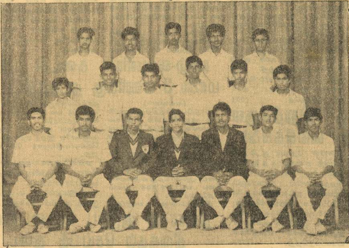
சென். பற்றிக்ஸ் அணி