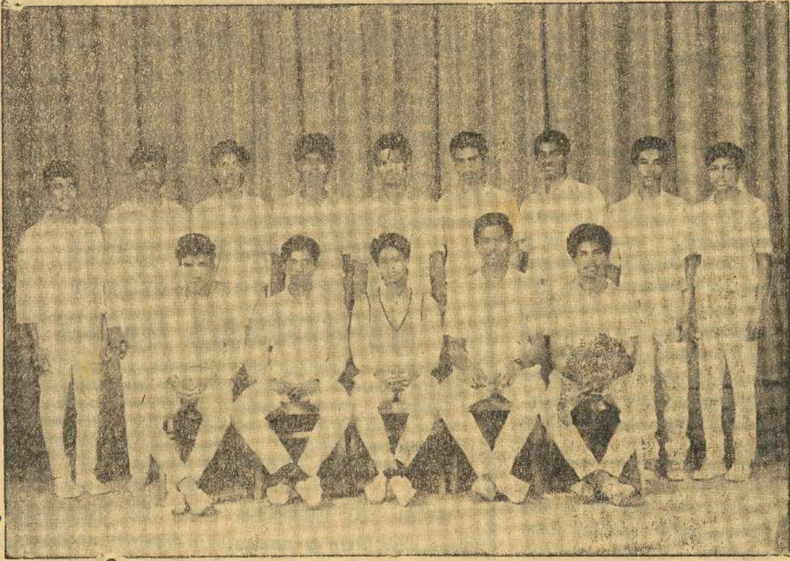
யாழ்ப்பாணக் கல்லூரி அணி