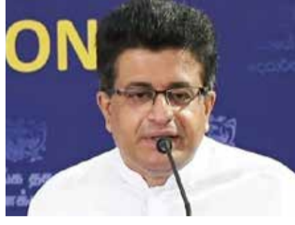
தத்தை முழுமையாக அமுல்படுத்துவதற்கு கடுமையாக எதிர்ப்பை வெளியிட்டுள்ள அவர், அத்திருத்தம் இலங்கையை இன ரீதியாக பிளவுபடுத்தும் என்றும் எச்சரித்துள்ளார். (அ)