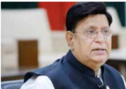
இலங்கைக்கு மேலும் ஆறு மாத கால அவகாசம் வழங்கியமை குறிப்பிடத்தக்கது. (அ)

கொழும்பு, பெப். 07 200 மில்லியன் டொலர் கடனை எதிர்ப்பும் செப்ரெம்பருக்குள் இலங்கை திருப்பிச் செலுத்தும் என எதிர்பார்ப்பதாக பங்களாதேஷ் வெளிவிவகார அமைச்சர் தெரிவித்துள்ளார். இலங்கை படிப்படியாக முன்னேறி வருகின்ற இந்தநிலையில் கடனைத் திருப்பிச் செலுத்துவதற்கு செப்ரெம்பர் வரையில், அவகாசம் அளிக்கப்பட்டுள்ளது என அவர் குறிப்பிட்டார். 2021 ஆம் ஆண்டு பெற்றுக்கொண்ட 200 மில்லியன் டொலர் கடனை கடந்த மார்ச் மாதம் இலங்கை திருப்பிச் செலுத்தியிருக்க வேண்டும். எனினும், இலங்கை மேலும் கால அவகாசம் கோரியதை அடுத்தே பங்களாதேஷ் மத்திய வங்கி இலங்கைக்கு மேலும் ஆறு மாத கால அவகாசம் வழங்கியமை குறிப்பிடத்தக்கது. (அ)