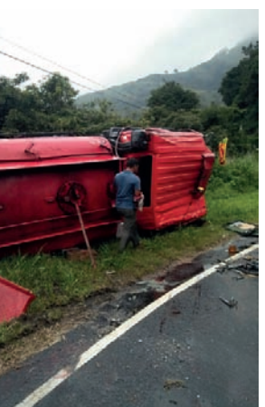
கொண்டு செல்லப்பட்டுள்ளது. இதன்போது பெளசரின் சாரதி மற்றும் உதவியாளர் ஆகியோர் காயமடைந்து உட்தும்பர வைத்தியசாலையில் அனுமதிக்கப்பட்டுள்ளனர். விபத்து தொடர்பான விசாரணைகளை உட்தும்பர பொலிஸார் மேற்கொண்டு வருகின்றனர்.

வேன் டெண்டர் பேராதனை சரசலி உயன் எரிபொருள் களஞ்சியசாலையிலிருந்து மஹியங்களை இ.போ.ச டிப்போவுக்கு 6,000 லீற்றர் டீசலைக் கொண்டு சென்ற பெளசர், உடுதும்பர பகுதியில் வீதியை விட்டு விலகி விபத்துக்குள்ளாகியுள்ளது. உடுதும்பர-கோவில்மட பிரதேசத்தில் நேற்றுமுன்தினம் (05) மாலை 4.30 மணியளவில் இந்த விபத்து இடம்பெற்றுள்ளது. இதன்போது பெளசரிலிருந்த 4,000 லீற்றர் டீசல் வெளியேறியுள்ளதுடன், எஞ்சியிருந்த 2,600 லீற்றர் டீசல் பேராதனை எரிபொருள் களஞ்சியசாலைக்கு மீண்டும்