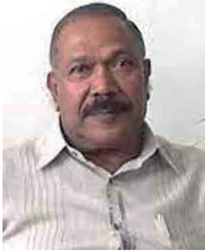
தொழிலாளர் முன்னணி என்ற அமைப்பினுடைய காரியாலயத்திற்கு அனுப்பிவைக்குமாறு தொழில் உறவு அதிகாரி ஊடாக கடிதம் மூலமாக அறிவித்திருக்கின்றமையானது முற்றிலும் தவறானதும் நிதி மோசடியில் ஈடுபடுகின்ற ஒரு

தொழிலாளர் முன்னணியின் தலைவரும் நுவரெலியா மாவட்ட பாராளுமன்ற உறுப்பினருமான வேலுசாமி இராதாகிருஸ்ணன் தெரிவித்துள்ளார். மலையக மக்கள் முன்னணி மலையக தொழிலாளர் முன்னணி ஆகியவற்றின் நிர்வாக சபை கூட்டம் நேற்று முன்தினம் (5) தலவாக்கையில் நடைபெற்றது. இங்கு தொடர்ந்து கருத்து தெரிவித்த அவர், எங்களுடைய கட்சியின் உறுப்பினராக இருந்த அ.அரவிந்தகுமாரின் இந்த அரசாங்கத்துக்கு ஆதரவு அளித்து, இராஜாங்க அமைச்சராக செயற்படுகின்ற நிலையில், அவர் முன்னணி அங்கத்தவர்களின் சந்தா பணத்தை அரவிந்தகுமாரின் தலைமைத்துவம் வகிக்கின்ற ஜக்கிய