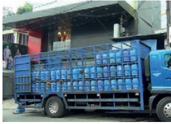
இந்த நிலையில், நேற்றுமுன்தினம் (05) நள்ளிரவுடன் லிட்ரோ சமையல் எரிவாயுவின் விலை அதிகரிப்பையடுத்து, நேற்று (06) அதிகாலை தொடக்கம் முகவர் நிலையங்கள் திறக்கப்பட்டுள்ளன.