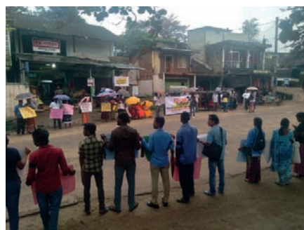
சுட்டிக்காட்டினர். வார இறுதி நாள்களில் அதிகளவான சுற்றுலாப் பயணிகள் இப்பகுதிக்கு வருவதால், குறித்த வீதியில் உள்ள ஆபத்தான இடங்களை உரிய அதிகாரிகள் அவதானித்து வீதியை உடனடியாக சீரமைக்க நடவடிக்கை எடுக்குமாறு ஆர்ப்பாட்டக்காரர்கள் கோரிக்கை விடுத்துள்ளனர்.