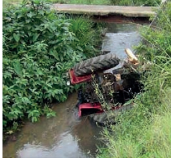
இவ்வாறு தானாகவே இயங்கிய ட்ரெக்டரை நிறுத்துவதற்கு சாரதி முயன்ற போது படுகாயமடைந்தார். அவர், டிக்கோயா வைத்தியசாலையில் அனுமதிக்கப்பட்டுள்ளார் என ஹட்டன் பொலிஸார் தெரிவித்தனர்.