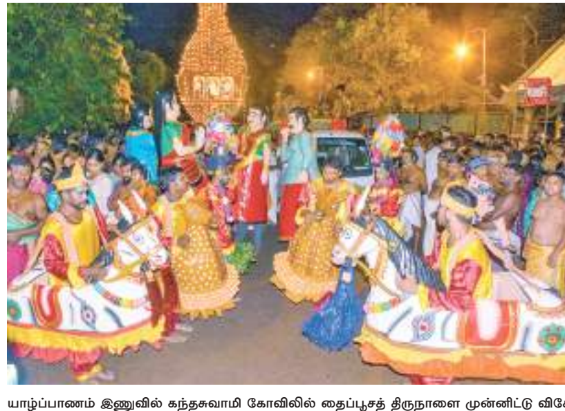
யாழ்ப்பாணம் இணுவில் கந்தசுவாமி கோவிலில் தைப்பூசத் திருநாளை முன்னிட்டு விசேட பூஜை நிகழ்வுகள் இடம்பெற்றன.

ளவில் பாதிக்கப்பட்டுள்ளதாக விவசாயிகள் தெரிவிக்கின்றனர். குறிப்பாக நானாட்டான் பிரதேச செயலகத்துக்குட்பட்ட பல கிராமங்களிலும் முருங்கன் குளத்தின் கீழ் உள்ள ஓலுமடு பகுதியிலுள்ள விவசாய நிலங்கள் இவ்வாறு பாதிக்கப்பட்டுள்ளதாக விவசாயிகள் தெரிவிக்கின்றனர்.