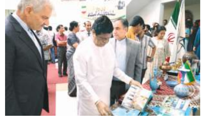
சுரான் திரைப்பட விழா நேற்று கொழும்பில் ஆரம்பித்து வைக்கப்பட்டது. இந்நிகழ்வில் பிரதம அதிதியாக கலந்து கொண்ட ஊடகத்துறை அமைச்சர் கலாநிதி பந்துல குணவர்த்தன மற்றும் சுரான் இஸ்லாமிய குடியரசின் தூதுவர் உட்பட அதிகாரிகளையும் படங்களில் காணலாம்.