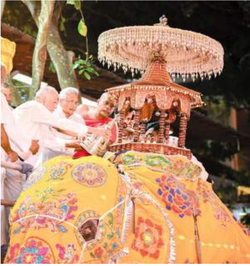
கொழும்பு கங்காராம விகாரையின் வருடாந்த பெரஹாரவை முன்னிட்டு நேற்று முன்தினம் (05) இரவு ஜனாதிபதி ரணில் விக்கிரமசிங்க மற்றும் முன்னாள் ஜனாதிபதி கோட்டா பராஜபக்டை ஆசியோரால் பாணை மீது புனித பேழை வைக்கப்பட்டபோது எடுத்த படம்.