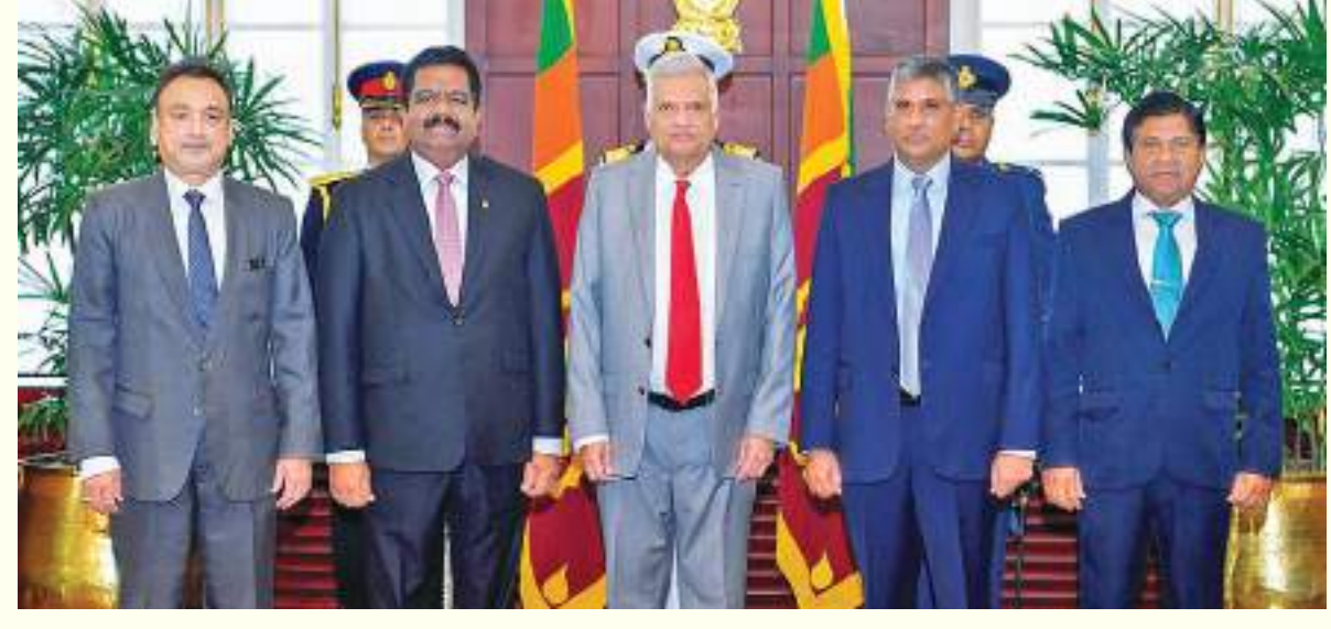
உயர் நீதிமன்ற நீதியரசர் ஒருவர் உட்பட மூவர் நேற்று காலை ஜனாதிபதி ரணில் விக்கிரமசிங்க முன் னிலையில் பதவிப்பிரமாணம் செய்துகொண்டனர். அதன்படி, மேன்முறையீட்டு நீதிமன்றத்தின்