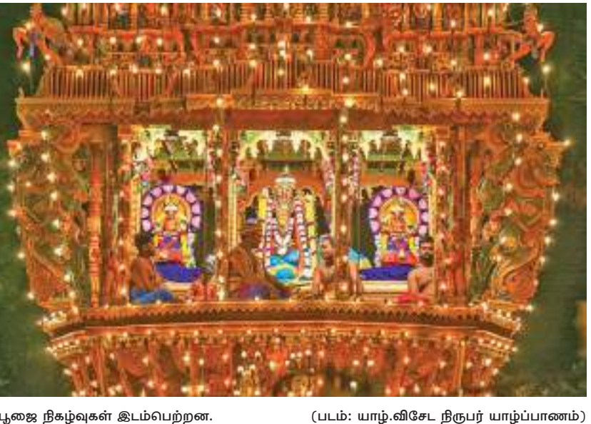
(டபம்: யாழ்.விசேட நிருபர் யாழ்ப்பாணம்)