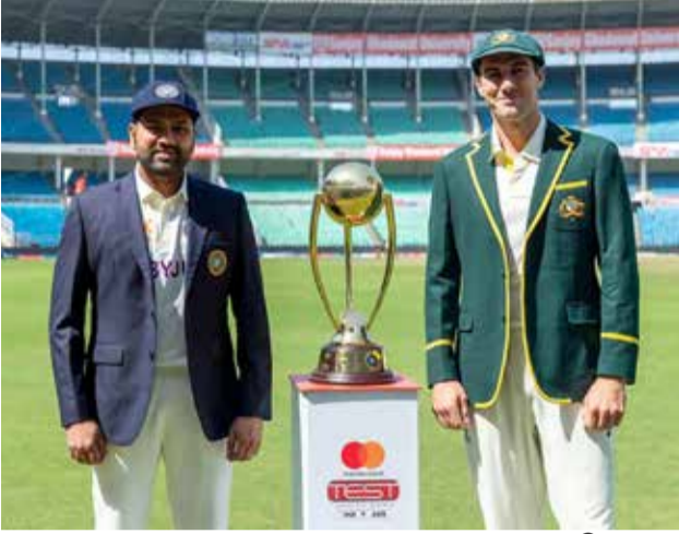
நாக்பூர், பெப். 09

போர்டர் - கவாஸ்கர் கிண்ணத்துக்காக அவுஸ்திரேலியா - இந்தியா அணிகள் மோதும் 4 போட்டிகள் கொண்ட டெஸ்ட் தொடர் இன்று வியாழக்கிழமை ஆரம்பமாகிறது. நாக்பூரில் தொடங்கும் முதல் போட்டியில் இந்தியா மூன்று சுழல் பந்து வீச்சாளர்களுடன் களமிறங்குகிறது. நாக்பூர் மைதானத்தின் ஆடுகளம், ஆட்டத்தின் முதல் நாளில் இருந்தே சுழல் பந்து வீச்சாளர்களுக்கு சாதகமானதாக இருக்கலாம் எனத் தெரியும் நிலையில் அந்த அணியின் தலைவர் ராகுல் இந்த முடிவை எடுத்துள்ளார். மேலும், இந்திய அணியில் விக்கெட் காப்பாளர், 3ஆவது சுழல் பந்துவீச்சாளர், துடுப்பாட்டத்தில் 5ஆவது வீரர் ஆகிய 3 முக்கிய இடங்களுக்கான தெரிவு பலத்த எதிர்பார்ப்பை ஏற்படுத்தியிருக்கிறது. இந்நிலையில், செவ்வாய்க்கிழமை செய்தியாளர் களை சந்தித்த அந்த அணியின் தலைவர் கே. எல். ராகுல்