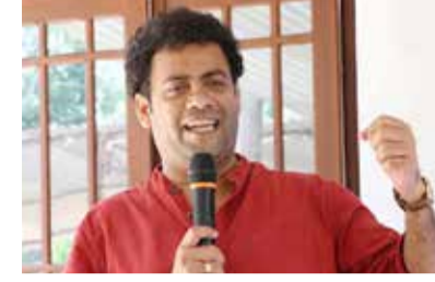
கொழும்பு, பெப். 09