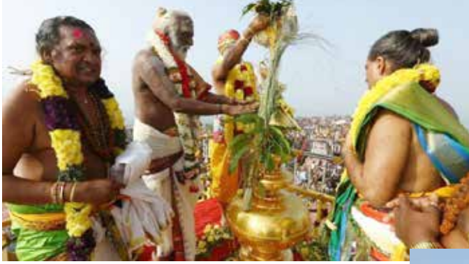
வேண்டுகோளை ஏற்று பிராயச்சித்த கும்பாபிஷேகம் நடத்த வேண்டும்.

இது தொடர்பாக அவர் வெளியிட்டுள்ள அறிக்கையில், “பழனி அருள்மிகு தண்டாயுதபாணி திருக்கோவில் கருவறைக்குள் அத்துமீறி நுழைந்த இந்து சமய அறநிலையத்துறை அமைச்சர், அதிகாரிகள் பகிரங்க மன்னிப்பு கேட்க வேண்டும். தலைமை அர்ச்சகரின்