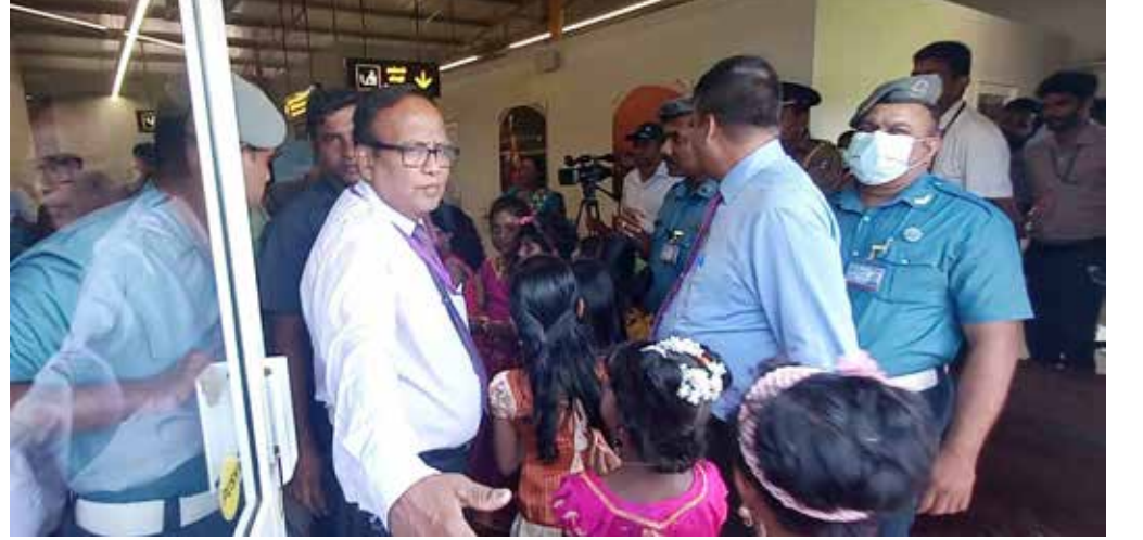
யாழ்ப்பாணம், பெப். 10