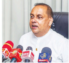
மேற்கொண்டிருக்கும் மெட்ரிக் தொன் பொலம்பேட் உரம் தரம் குறைவாக வராததால் திட்டமிடப்பட்டிருந்தது. ஆனால், உரம் தரம் குறைவாக வராததால் திட்டமிடப்பட்டிருந்தது.

சீனாவிலிருந்து இந்த வாரத்திற்குள் வரவிருந்த 36 ஆயிரம் மெட்ரிக் தொன் டிரைபிள் கம்பாட் (TSP) உரத்தை தரமின்மையே காரணமாக இவ்வாரம் நிராகரிக்க அரசு அமைச்சர் மஹிந்த அமரவீர தெரிவித்துள்ளார். “சீனாவிலிருந்து அனுப்பப்பட்ட TSP உர மாதிரிகள் தரம் குறைவாக இருந்ததால் நாம் கனம் அமைச்சர் நிராகரிக்கிறோம்” என்று விவசாய அமைச்சர் மஹிந்த அமரவீர தெரிவித்தார். “மற்ற நாடுகள் இந்த வகை உரங்களைப் பயன்படுத்தினாலும், நாம் உரம் தரத்துடன் மட்டுமே வாங்குகிறோம், அவற்றை விவசாயிகளின் கைகளில் கொடுக்க முடியாது.” உரம் தரம் குறைவாக வரத்தின் TSP உரம் நாட்டை வந்தடைய திட்டமிடப்பட்டிருந்தது. ஆனால், உரம் தரம் குறைவாக வராததால் திட்டமிடப்பட்டிருந்தது. ஆனால், உரம் தரம் குறைவாக வராததால் திட்டமிடப்பட்டிருந்தது.