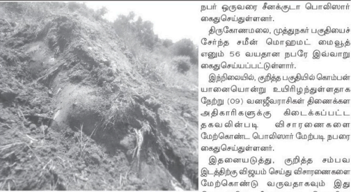
(அப்துல்ஹம் யாசிப்) திருகோணமலை, கம்பத்தூறு பகுதியில் வயல் உரிமையாளர் ஒருவர் தனது வயல் பகுதியை பாதுகாக்கும் நோக்கில் அமைக்கப்பட்டிருந்த மின்வேலியில் சிக்கலுக்கு உயிரிழந்த யானையை புதைத்த சம்பவத்துடன் தொடர்புடைய சந்தேக