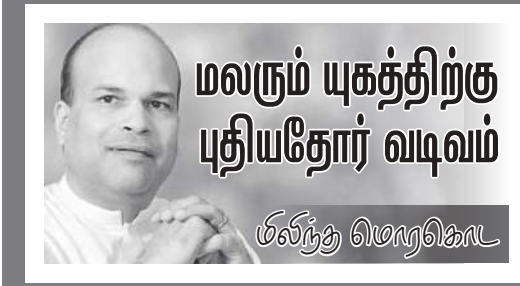
மலரும் யுகத்திற்கு புதியதோர் வடிவம்

மலையகத்தில் கம்பனிகள் மக்களைச் சுரண்டுவதை நாம் அறிவோம், அதனை நிறுப்பதற்கான ஆதாரங்கள் எங்கிலிடம் உள்ளன. ஐ.நா சிறப்பு அறிக்கையாளரின் அறிக்கை கூட எங்கிலிடம் உள்ளது. அதில் நிறுவனங்கள் தொழிலாளர்களைச் சுரண்டுகின்றன என்று தெளிவாகக் கூறப்பட்டுள்ளது.