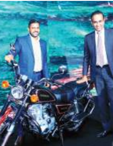
படம் உதிரிப்பாகங்களை மேலும் அதிகமாக சேர்க்க திட்டமிடப்பட்டுள்ளது.

இதன் மூலம் வெளிநாட்டு இறக்குமதிகளை குறைப்பதன் மூலம் இலங்கையின் பொருளாதாரத்தை பலப்படுத்த பங்களிப்பு செய்வதோடு நாணய வெளியேற்றலையும் தடுக்கிறது. Senaro GN125 மோட்டார் சைக்கிள் சந்தையில் ரூ. 590,000 விற்கப்படுவதோடு 60,000 கி.மீ. உத்தரவாதமும் வழங்கப்படுகிறது. இதற்கான உதிரிப்பாகங்கள் கையிருப்பில் உள்ளதோடு தீவு முழுவதும் விற்பனைக்குப் பிந்திய சிறந்த சேவை வழங்குனர்கள் மற்றும் பிரதிநிதிகளும் நியமிக்கப்பட்டுள்ளனர். செனாரோவின் உற்பத்திகள் எதிர்காலத்தில் அதன் தயாரிப்புகளுடன் உலகளாவிய சந்தைகளை ஆராய்ந்து உருவாக்குவதாகும்.