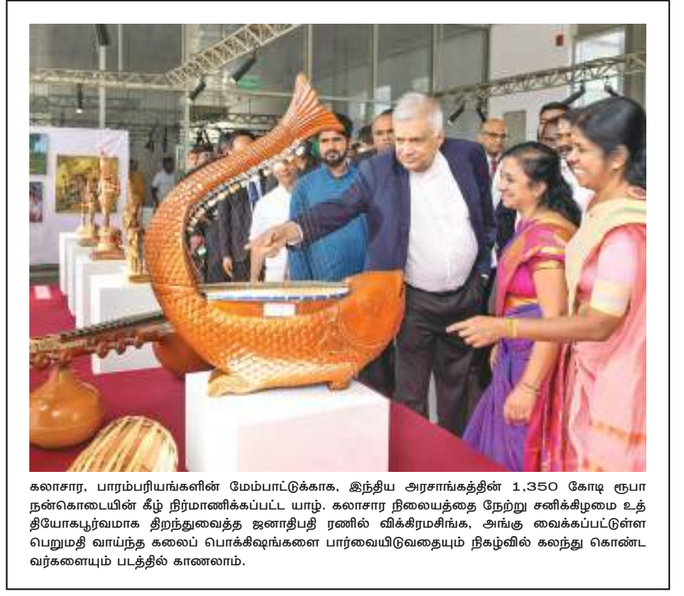
கலாசார, பாரம்பரியங்களின் மேம்பாட்டுக்காக, இந்திய அரசாங்கத்தின் 1.350 கோடி ரூபா நன்கொடையின் கீழ் நிர்மாணிக்கப்பட்ட யாழ்ப்பாணம் கலாசார நிலையத்தை நேற்று சனிக்கிழமை உத்தியோகபூர்வமாக திறந்துவைத்த ஜனாதிபதி ரணில் விக்கிரமசிங்க, அங்கு வைக்கப்பட்டுள்ள பெறுமதி வாழ்ந்த கலைப் பொக்கிஷங்களை பார்வையிடுவதையும் நிகழ்வில் கலந்து கொண்ட வர்களையும் படத்தில் காணலாம்.

யுத்தத்துக்கு முன்னர் தேசிய பொருளாதாரத்துக்கு வடமா காணம் பாரிய பங்களிப்பை பரந்தளவில் வழங்கியதாகத் தெரிவித்த ஜனாதிபதி, அந்த வலுவான பொருளாதாரத்தை வடக்கில் மீண்டும் ஏற்படுத்தத் தேவையான அபிவிருத்தி வேலைத்திட்டம் நடைமுறைப்படுத்தப்படுமெனவும் தெரி வித்தார். நல்லிணக்கத்தினூடாக மாத்திரம் பொருளாதாரத்தை கட்டி யெழுப்ப முடியாது. பொருளாதார அபிவிருத்தியின் வேகம், மக்களின் மனப்பாங்கு மற்றும் அர்ப்பணிப்பிலேயே அது, தங்கியுள்ளதாகவும் ஜனாதிபதி